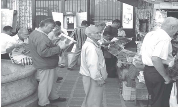
Figura N.º 1 la lectura en torno al kiosco de revistas y periódicos.

Todas estas prácticas de lectura y su promoción son espontáneas. A pesar de que el kiosco es un lugar propicio para leer y promover la lectura y, a través de ésta, la salud, el bienestar, el trabajo y la democracia, no se registraron actividades que formen parte de programas, proyectos o planes de lectura del gobierno ni de la empresa privada.