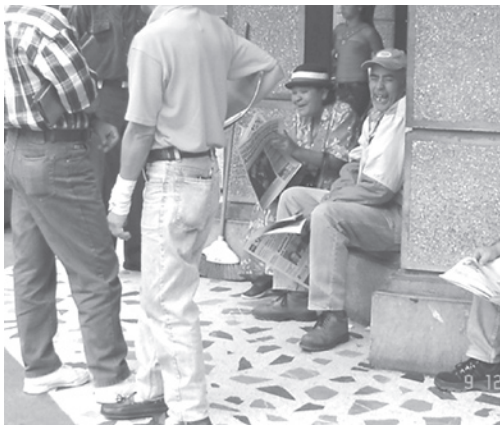
Figura N.º 2 Las conversaciones en torno a la lectura en el kiosco

Posterior a la lectura que se realiza en torno al kiosco de revistas y periódicos se desarrollan interesantes intercambios, tanto para argumentar puntos de vista como para incentivar a que otro lea o se incorpore a las discusiones. Generalmente, se discute sobre temas políticos, sociales, económicos y deportivos. Hay usuarios fijos que, a pesar de la frecuencia con que visitan el kiosco, no llegan a ser clientes; sin embargo, son estimados y extrañados.