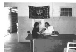
Figura 2. Entrevista realizada a una de las docentes de la II etapa.

Se utilizó la observación de tipo ordinaria, ya que los investigadores no formaron parte del grupo. Se empleó la hoja de registro, con aspectos relacionados al eje transversal ambiente y al enfoque inteligente. También se realizaron entrevistas semiestructuradas, aplicando el guión para entrevista, grabaciones, fotografías y filmaciones (Figura 2).