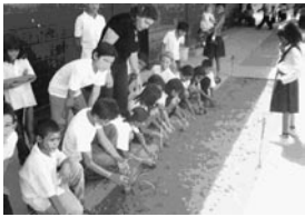
Figura 3. Actividad de plantación de especies botánicas. Realizada por los alumnos de cuarto grado.

Estrategias empleadas para aplicar el eje transversal ambiente. Los actores manifestaron el empleo de estrategias como reciclaje de materiales, plantación de especies botánicas (Figura 3), observación, pintura de murales (Figura 4), descripción, cuentos, lecturas, anécdotas, elaboración de afiches y trípticos, charlas y actividades de limpieza.