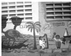
Figura 4. Mural elaborado por los alumnos y docentes de la Escuela Básica "Santa Rita"

Recursos. Láminas, retroproyectors, maquetas, copias, folletos, materiales de desecho, plantas, películas, afiches y libros de consulta.