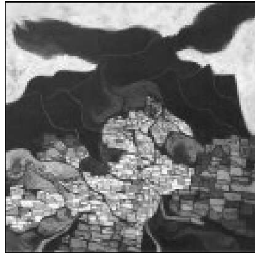
QUITO DE LA NUBE NEGRA

Los simples tristes ojos de una adolescente de un cuadro de Oswaldo Guayasamín, o simplemente "Quito de la Nube Negra" del mismo, con un bien tratamiento metodológico podía hacernos concebir alguna generalización interesante y significativa acerca del paisaje