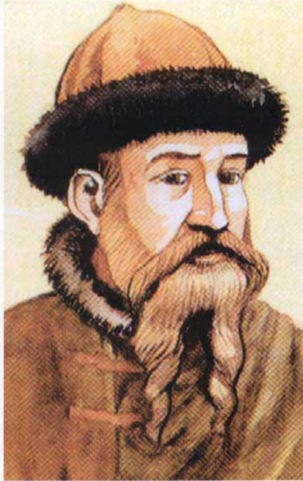
Gutenberg; Imagen tomada de "El libro del Libro".

Ya para el siglo XIX, antes de la invención de la fotografía, la iconografía refleja, respecto a los siglos anteriores, cambios importantes: la imagen ha perdido prácticamente su función sagrada, escapa al control del poder e incluso es utilizada tímidamente con fines pedagógicos. La densificación de la imagen ha dado ya sus primeros pasos, signada por las exigencias de una nueva estructura social marcada por aires democráticos, liberales, capitalistas y preindustriales. Las condiciones eran propicias para recibir el gran invento de la fotografía que marcó la historia entre la era de la produc-