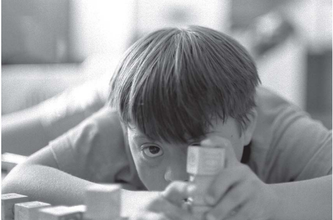
Autor: Andrea Soledad Páez Ball