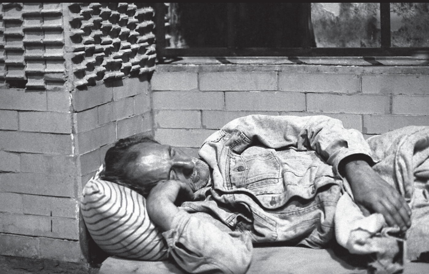
Autor: Anny Lorena Gómez Nieves Primer premio de fotografía

El II Simposio Ciudad, celebrado en esta capital andina en octubre de 2005, convocó a especialistas en urbanismo, sociología, arte y otras disciplinas, a estudiantes de educación media y al público en general, para repensar la problemática de las ciudades y plantear soluciones. El encuentro, organizado por el Centro de Investigaciones en Ciencias Humanas (HUMANIC), de la Universidad de Los Andes, con apoyo de diferentes instituciones, abrió además espacio para el concurso de carteles y fotografías que revelaran nuevas visiones sobre la ciudad. Más de 80 participantes decidieron tomar su cámara y compartir, con interesante propuesta visual, artística y un profundo significado humano, escenas que dejan ver algo más allá de la Mérida sencilla y cotidiana. Compartimos aquí una muestra de alguna de las fotografías de las series presentadas por los ganadores, y concursantes con mención especial.