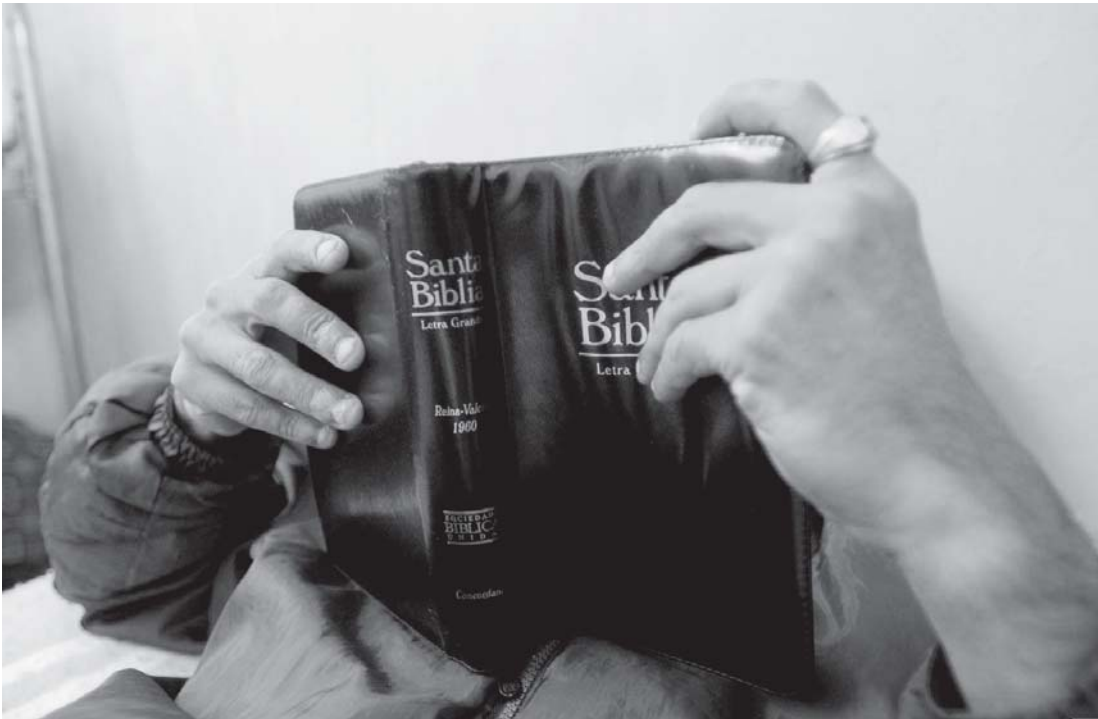
Autor: Álvaro Hernández Angola