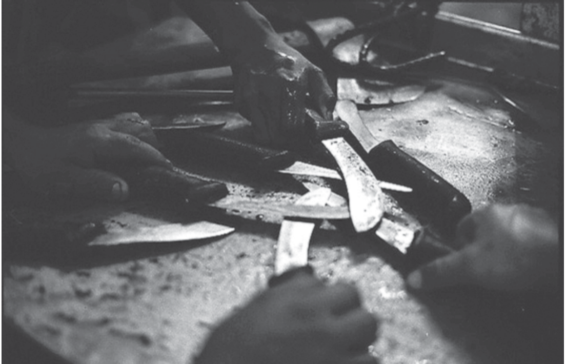
Autor: Elio Dalí Ruiz Contreras