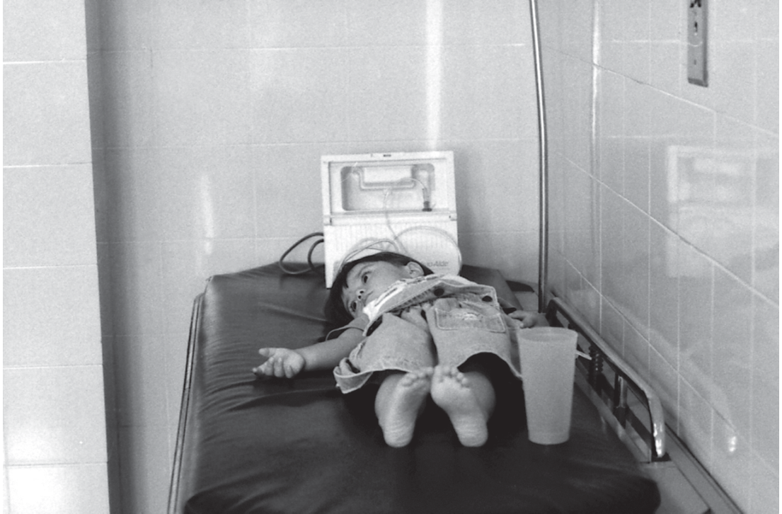
Autor: José Antonio Flores Segundo premio de fotografía