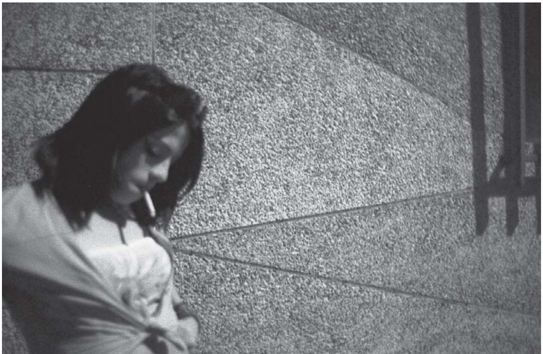
Autor: Alejandro Juan Betancourt Tercer premio de fotografía