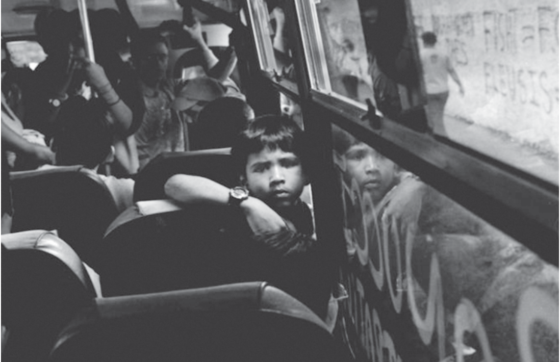
Autor: Jhonnatan freites