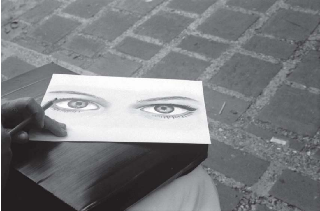
Autor: Alcione Esmeralda Guerrero Díaz