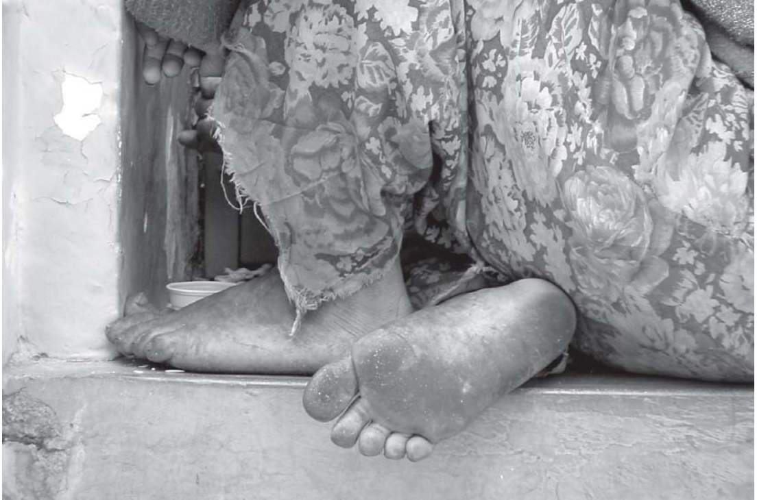
Autor: Odette Díaz Nava