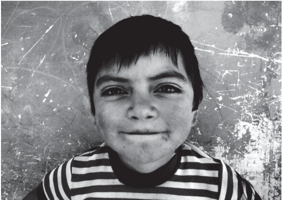
Autor: Julio César Álvarez Gualdrón