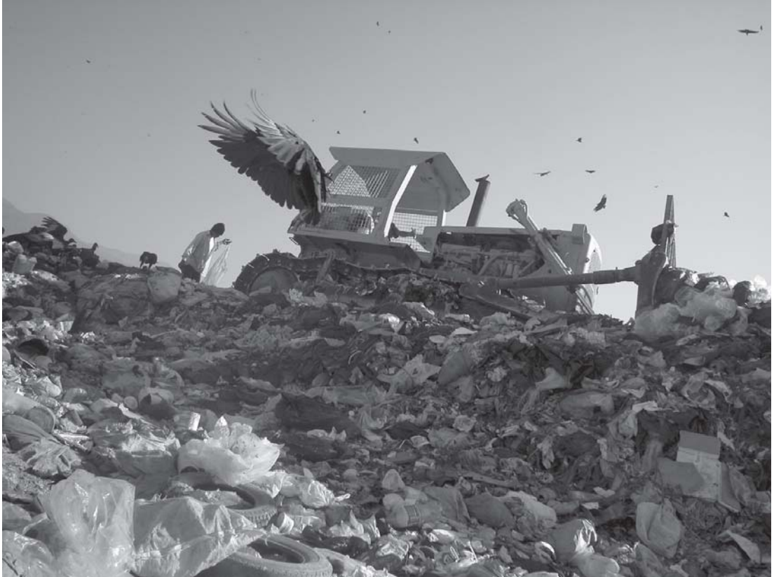
Autor: Alí Jesús Colmenares Ramírez