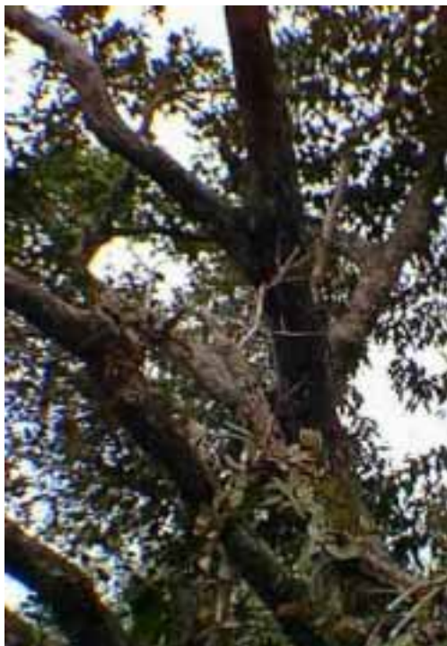
Figura 1. Aspecto general del forofito Eschweilera parviflora , (árbol N° 21) Lecythidaceae.

Con la finalidad de evaluar la existencia de patrones de distribución de las plantas del dosel sobre el portador, se pueden establecer "zonas" mediante estratos de diferentes alturas (por ejemplo: cada 2 m (Brown 1990) o cada 4 m (Kelly 1985)), las cuales inevitablemente fallan en correspondencia con las "zonas" naturales de condiciones ambientales debido a la naturaleza desigual del dosel (Johansson 1974, 1975). Johansson (1975) divide la distribución de las epifitas en el portador en nueve patrones principales, que difieren entre sí por la "preferencia" de una especie epifita por una determinada sección del forofito y/o varias de ellas.