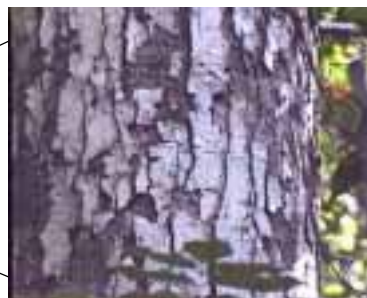
Figura 2. Corteza de forofito N° 21.

Con la subdivisión del forofito según el modelo presentado en la Figura 3, se diferencian biotopos que representan unidades ecológicas con una flora epifita característica (Brown 1990). Con este criterio se establecieron cinco secciones o biotopos. Las Secciones I (0 - 4 m de altura) y II (4 - 15 m de altura) se encuentran relacionadas directamente con el fuste principal del portador. La Sección III (16 - 21 m de altura y 10 cm. de diámetro) es la porción con mayor diámetro de las ramas principales del portador incluyendo la bifurcación y la fracción del tronco. La Sección IV, rodea la