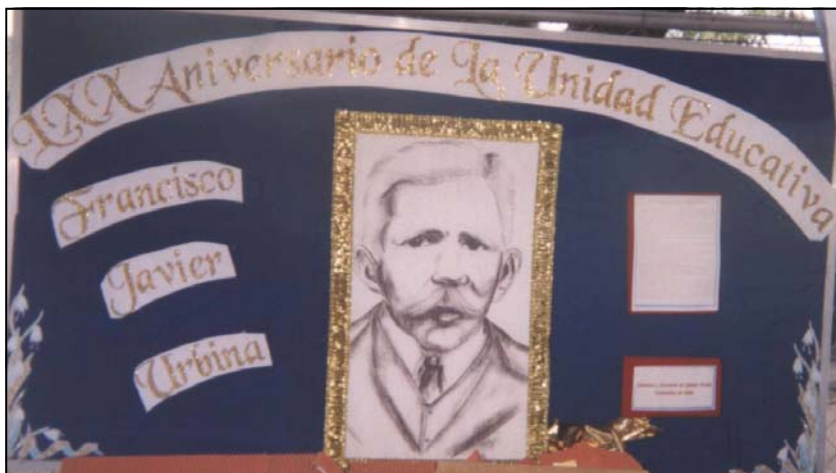
Cartelera de la reseña ganadora