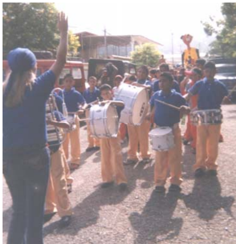
La banda de la escuela

En la semana aniversaria de la Unidad Educativa “Francisco Javier Urbina” tuvimos un desfile con todos los alumnos de la escuela y otros invitados, fueron también docentes, representantes y las demás personas que se acercaban a la Plaza Bolívar de Flor de Patria. Cada grupo tenía uniformes de diferentes colores, mi sección lucía franela y gorras de color amarillo con gris y la pancarta nuestra estaba identificada como “Los Vencedores”. Había cola de carros porque se pararon para que el desfile pasara, algunos choferes, motivados al vernos tan alegres, tocaban sus cornetas y reían. Mi mamá y mi papá me acompañaron muy contentos, bailando al ritmo de la banda musical que iba al frente del desfile. Cuando llegamos al estadio “Paco Briceño” cansados, sudados y con demasiada sed, nos anunciaron y entramos trotando,