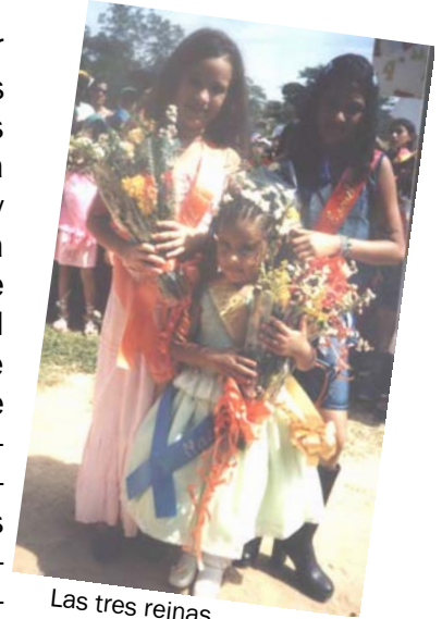
Las tres reinas