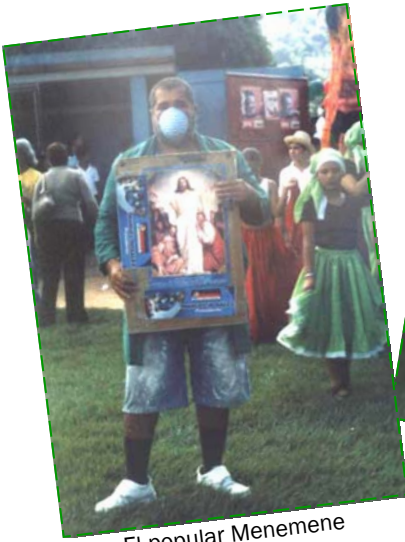
El popular Menemene