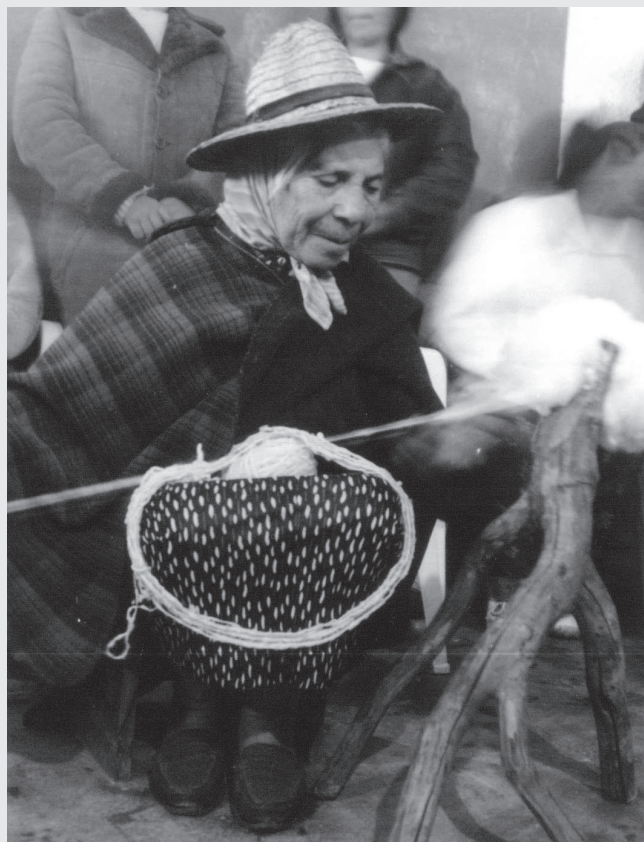
Mujer tejedora de Gavidia.