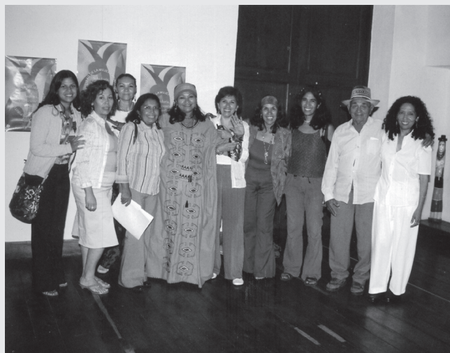
II Encuentro con la Espiritualidad de la Mujer Latinoamericana. Casa Bosset, Septiembre 2005.