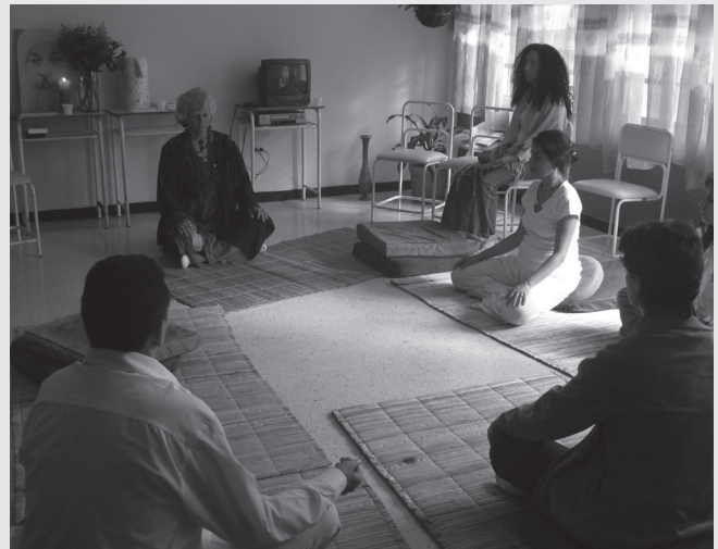
Taller vivencial "Despertar con OSHO" Año 2006.