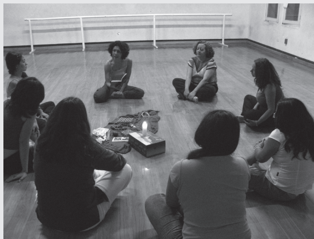
Clase abierta de expresión corporal. Mes de la Mujer y de Nuestra Madre Tierra. Marzo, 2007.