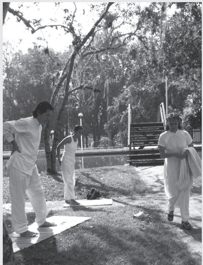
Yoga en el parque de la Isla.