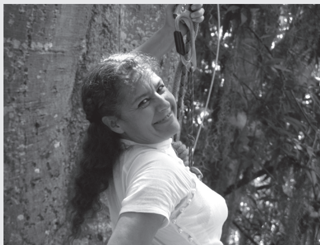
Actividad "Aventura con los árboles" en el Jardín Botánico de Mérida.