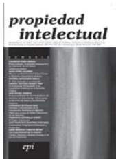
Tabla de Contenido Propiedad intelectual

Mérida, Venezuela. Año V. Nos 8 y 9. Diciembre 2006. ISSN-1316-1164