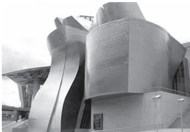
Museo Guggenheim. Bilbao. 1997 Arq. Frank O. Gehry

"...Esto produce un sentimiento de inquietud, de intranquilidad, al desafiar el sentido de identidad estable y coherente que asociamos a la forma pura. Es como si la perfección siempre hubiese contenido la imperfección, como si siempre hubiese tenido ciertas taras congénitas no diagnosticadas que empiezan ahora a hacerse visibles. La perfección es en secreto monstruosa. Torturada desde dentro, la forma aparentemente perfecta confiesa su crimen, su imperfección..."