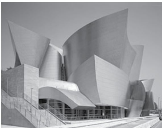
Walt Disney Concert Hall. Los Ángeles. EEUU. 2003. Arq. Frank O. Gehry