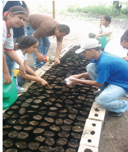
Figura 2. A la izquierda: Vivero del comité conservacionista "Vivero El Camel". A la derecha: Jornada de realización de vivero por el comité "El Guayacan".