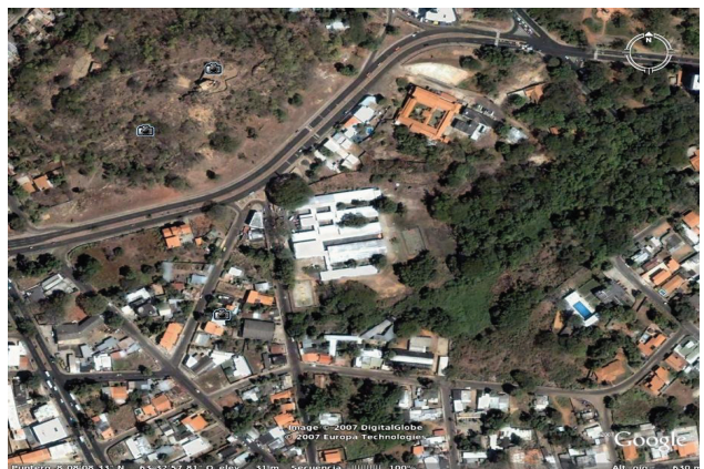
Figura 3. A la izquierda: Vivero "Lirio de los Valles". A la derecha: Área a reforestar por el comité conservacionista "San Isidro-Lic. Fernando Peñalver".