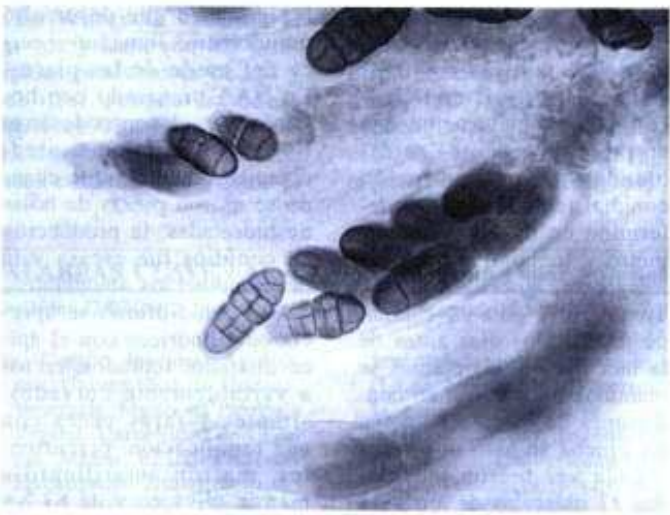
Fig. 2. Ascus con ascosporas de Pleospora allii , teleomorfo de S. vesicarium .

En ambos cultivos la infección comenzó a manifestarse como pecas blancas que más tarde se convirtieron en manchas fusiformes a elongadas con centro marrón claro a marrón amarillento y una ligera pigmentación púrpura (Figuras 3 y 4). Frecuentemente las manchas se unieron originando necrosis extensiva hacia o desde el ápice foliar. Conforme avanzaba la necrosis los tejidos afectados se iban tornando filiformes y retorcidos. Cuando las hojas de plántulas inoculadas