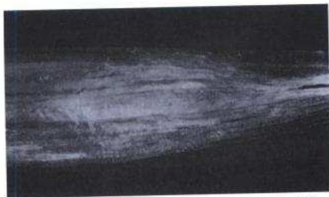
Figura 3. Lesión causada por S. vesicarium en hoja de ajo 'Mejicano Rojo'.