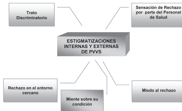
Gráfico N° 1. Categoría central y categorías emergentes

Se determinó la categoría o concepto central como Estigmatizaciones Internas y externas de las PVVS, ya que todas las expresiones narradas por los informantes dan cuenta de las distintas formas de sometimiento al rechazo y la discriminación así como también a su percepción personal sobre el VIH.