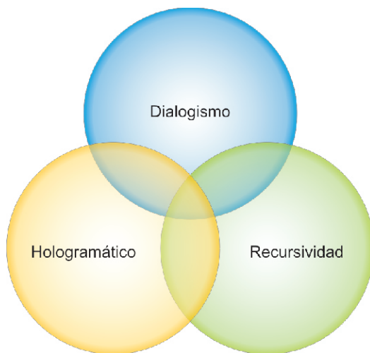
Gráfico 1: Principios de la complejidad.

Morin (2003), concibe la complejidad con base a tres aspectos (gráfico 1): en primer lugar, el principio dialógico que asocia dos términos: que a la vez son complementarios y antagónicos, que debieran rechazarse entre si, pero que a la vez son indisolubles para comprender una misma realidad; el segundo: el principio de recursividad organizacional, donde la causa es el efecto y éste a su vez es la causa; y el tercero: el principio hologramático, donde la parte está en el todo y el todo está en la parte, este es indivisible, al abstraer o fragmentar las partes y observarlas aisladamente se ignoran características presentes en el todo, por lo que el sujeto, el objeto y el contexto forman un todo inseparable.