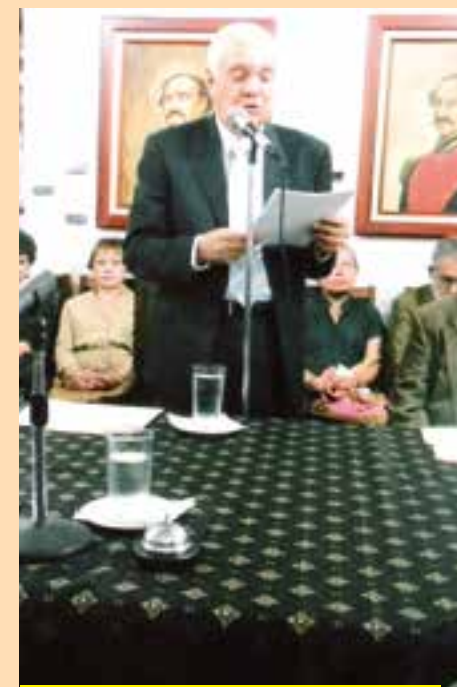
En la Academia de Mérida discurso de aceptación como miembro, año 2011.

Medalla al mejor egresado, Escuela Politécnica, 1956. Medalla Fray Juan Ramos de Lora (Bicentenario de la Universidad de Los Andes), 1985. Premiado en 1995, 1997, 2001, 2003 y 2005 como Miembro del Programa Estímulo al Investigador (PEI). Premio Regional de Ciencias Naturales y Exactas 1998, otorgado por FUNDACITE-Mérida. Distinguido por el FONACIT en el 2004 como Investigador Nivel IV en el Programa Promoción del Investigador. Premio 2005 de Fundacite Mérida al Grupo de Productos Naturales y Química Medicinal del cual es el coordinador. Dr. Honoris Causa, Universidad de Los Andes 2007.