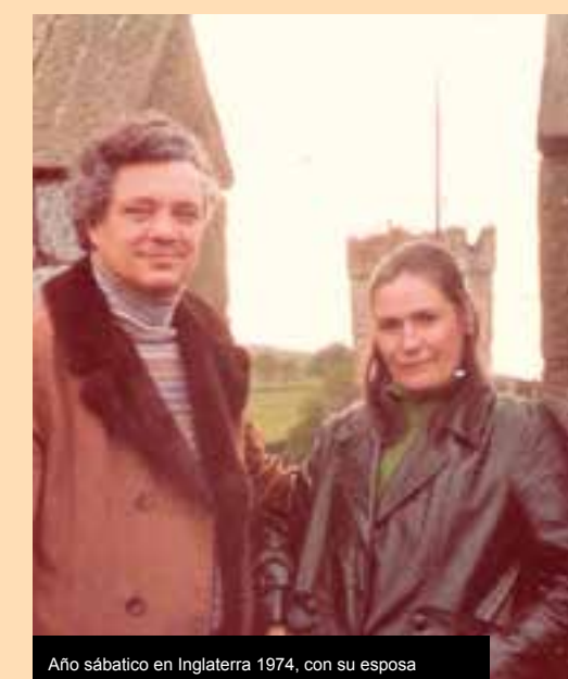
Año sabbático en Inglaterra 1974, con su esposa