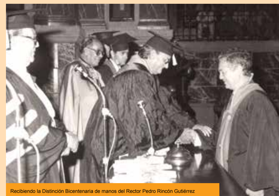
Recibiendo la Distinción Bicentennial de manos del Rector Pedro Rincón Gutiérrez