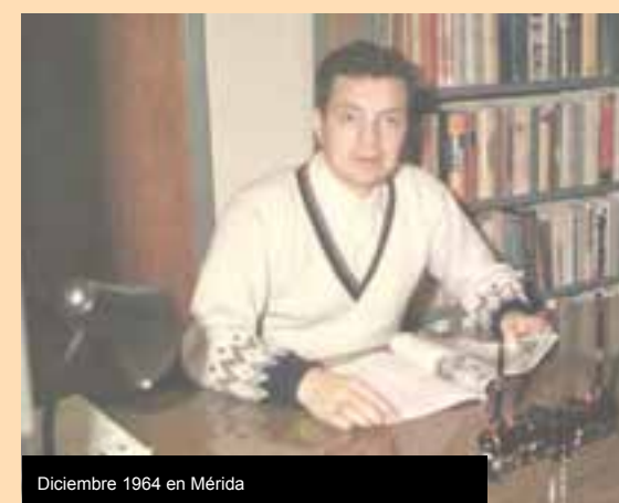
Diciembre 1964 en Mérida