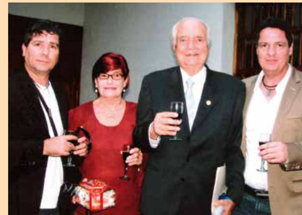
Con su esposa e hijos en la Academia de Mérida, año 2011.