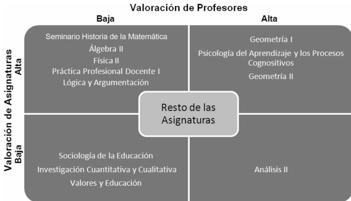
Fig. 1. Valoración que se otorga a profesores contra valoración que se otorga a asignaturas.

El Cuadro 2 representa la relación entre el número de veces que el estudiantado inscribe cada asignatura (NVA) y el Promedio de Calificaciones de Estudiantes (PCE). En este cuadro se representan cinco grupos donde se observan: asignaturas que son inscritas un alto número de veces y alto promedio estudiantil (Geometría I, Matemática II, Matemática I), asignaturas que son inscritas un bajo número de veces y alto promedio estudiantil (Práctica Profesio-