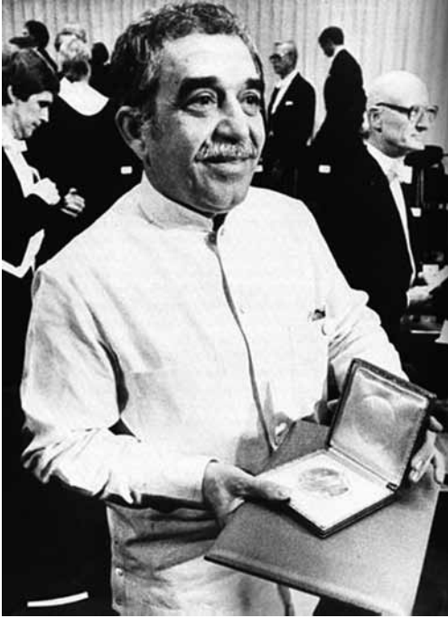
Gabriel García Márquez - La soledad de América Latina (discurso de aceptación del Premio Nobel 1982)

de El Salvador que hizo exterminar en una matanza bárbara a 30 mil campesinos, había inventado un péndulo para averiguar si los alimentos estaban envenenados, e hizo cubrir con papel rojo el alumbrado público para combatir una epidemia de escarlatina. El monumento al general Francisco Morazán, erigido en la plaza mayor de Tegucigalpa, es en realidad una estatua del mariscal Ney comprada en París en un depósito de esculturas usadas.