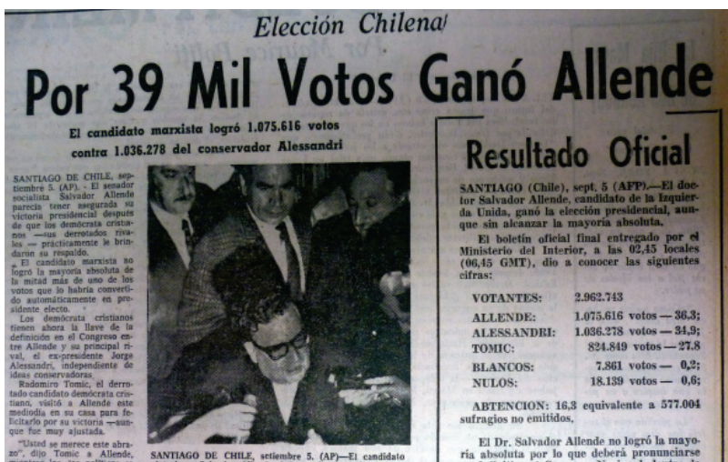
Imagen N° 2. El Universal , Caracas, 06 de septiembre 1970: Portada.

Al analizar las opiniones que se emitieron desde Venezuela en torno a la situación interna de Chile al momento en que triunfó Salvador Allende y la Unidad Popular, hay que señalar se mostró evidente como ellas se encontraron condicionadas por una interpretación de la realidad chilena hecha muchas veces en función del partido político al cual pertenecían sus emisores. Así por ejemplo, según el diputado del partido de Centro Izquierda Acción Democrática, Jaime Lusinchi, en una de las referidas entrevistas hechas por Carreño Ydrogo, la victoria de Allende se debió a que “la concepción conservadora de Alessandri