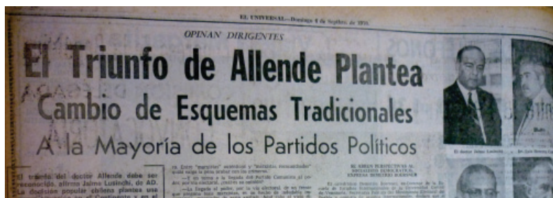
Imagen N° 3. El Universal , Caracas, 06 de septiembre 1970, Cuerpo 1, p. 10.

En la entrevista del 6 de septiembre, conocidos los resultados de los comicios electorales que daban por triunfador a Allende con una estrecha ventaja sobre el candidato conservador Jorge Alessandri, Carreño Ydrogo tituló su amplio artículo El triunfo de Allende plantea cambios de esquemas tradicionales a la mayoría de los partidos políticos , señalando en él que a su juicio resultaba “factible una revisión de la táctica y de la estrategia de las organizaciones políticas de Venezuela” 6 ; en relación al juicio de