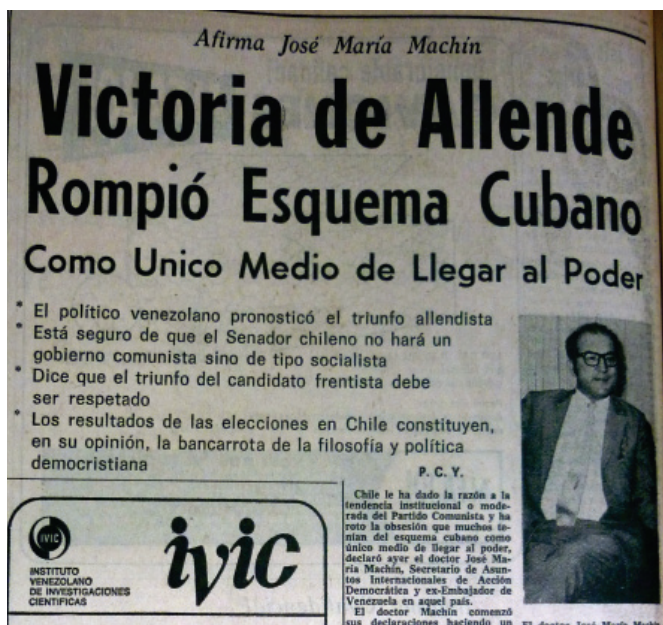
Imagen N° 4. El Universal , Caracas, 06 de septiembre 1970, Cuerpo 1, p. 14.

Se debe destacar que la numerosa serie de artículos de opinión correspondientes al mes de octubre, no fueron opiniones emitidas por políticos e intelectuales venezolanos, sino que El Universal se limitó a publicar artículos en la sección de Servicio Internacional Exclusivo para El Universal, donde se aprecian los nombres de Jean Pierre Bertrand, William Nicholson, Robert Coddington, Roberto Santamaría y Raúl Andrade. El balance de estos artículos muestra una imagen de descrédito de la figura de Allende y su programa de gobierno, en relación al cierre de empresas transnacionales, a la migración de estadounidenses y chilenos ante acenso al poder de un “comunista”, así como vaticinaban además que la libertad de prensa en Chile se vería coartada (véase Imagen N° 5). Un ejemplo de estas publicaciones es el artículo de Roberto Santamaría, quien con el título de Sellada la Suerte en Chile 14 , se dedicó