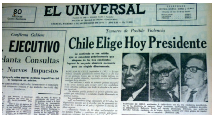
Imagen N° 1. El Universal , Caracas, 04 de septiembre 1970: Portada.

a) El primero, representa la significación que el proceso electoral de 1970 tuvo para la política interna chilena, en donde para el momento de las elecciones se debatieron tres tendencias políticas marcadas por diferentes programas de gobierno: el programa conservador impulsado por Jorge Alessandri, el partido demócratacristiano con Radomiro Tomic quien pretendía dar continuidad a los planes impulsados por el gobierno saliente de Eduardo Frei; y el candidato Salvador Allende,