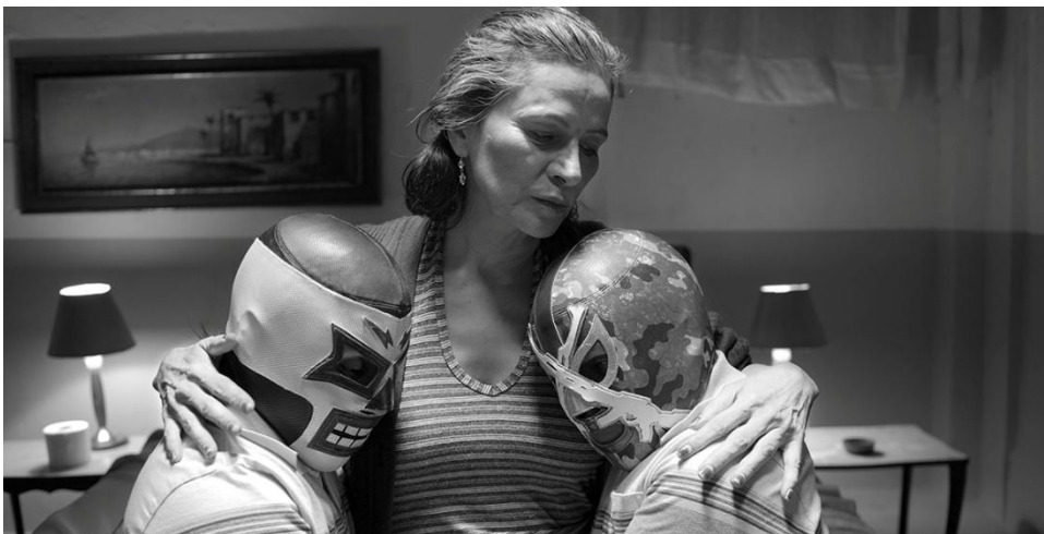
(Foto 4) Animalizaciones y pulsiones: los luchadores de La calle de la amargura .