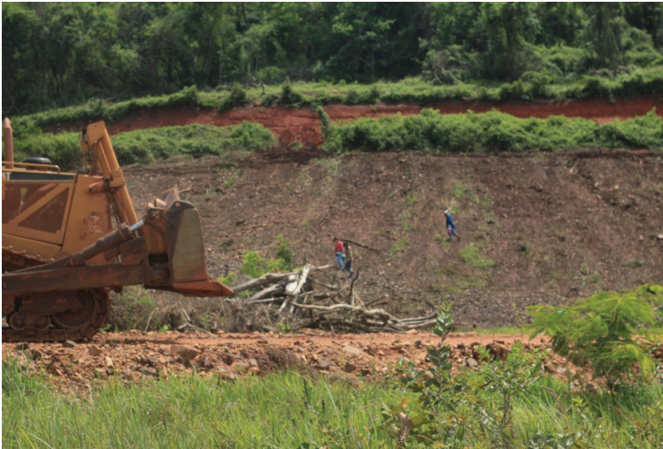
Foto N°1: Limpieza del material deforestado con maquinaria y sus efectos sobre el área prospectada en la UP8 de Tocomá.

Integridad de los conjuntos arqueológicos. Se trata de evaluar las condiciones en que se encuentran las relaciones contextuales como un todo (asociaciones entre artefactos, asociaciones entre artefactos y ecofactos, asociaciones entre ecofactos, etc.