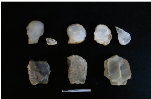
Foto N° 3. Preformas bifaciales del tipo Cola de Pescado rescatadas en Tocomá.

La lectura y asociación de los resultados del análisis de materiales con los datos geoespaciales construidos a partir de la información recabada en el campo, permitieron conformar un cuerpo de inferencias para, por un lado, caracterizar arqueológicamente cada una de las subáreas estudiadas y, por el otro, realizar una reconstrucción tentativa del proceso de poblamiento de este sector del Bajo Caroní, perfilando la visión geohistórica de Tocomá.