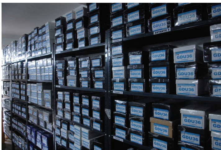
Foto N° 4. Aspecto del ordenamiento de la colección arqueológica del PIRA Tocomá.

Esto distingue al nuestro, del ordenamiento tradicional utilizado en el manejo de las colecciones producto de las anteriores investigaciones en el Bajo Caroní, donde los materiales mantienen, al ser almacenados, el orden generado por la clasificación realizada durante su análisis. La desventaja para las investigaciones posteriores es clara: para contrastar hipótesis, ahondar en líneas investigativas o aclarar dudas sobre los resultados iniciales, es necesario recomponer los contextos y asociaciones originales.