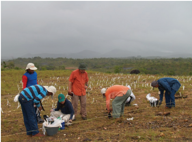
Foto N° 2: Recolección superficial sistemática por estaciones cuadrículas en la URA GDU25 La Punta.

Con las técnicas aplicadas durante la fase de recolección de datos se obtuvo información, se rescataron materiales y se relevaron hallazgos inmuebles con lo que se cumplió con una de las metas del PIRA, la detección y resguardo de los referentes del proceso histórico de la región estudiada.