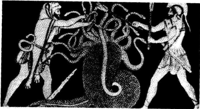
Hércules y la Hidra de Lerna

Licenciado en Geografía e Historia y Arte en la Universidad Santiago de Compostela, La Coruña-España (1989). Especialista en estudios de Historia Antigua Greco-romana. Profesor de la Unidad Educativa Claret (Caracas).