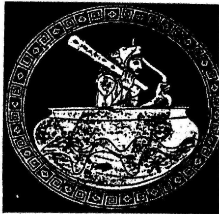
Copa ática de figuras rojas, de Vulci (aprox. 480 a.C.).