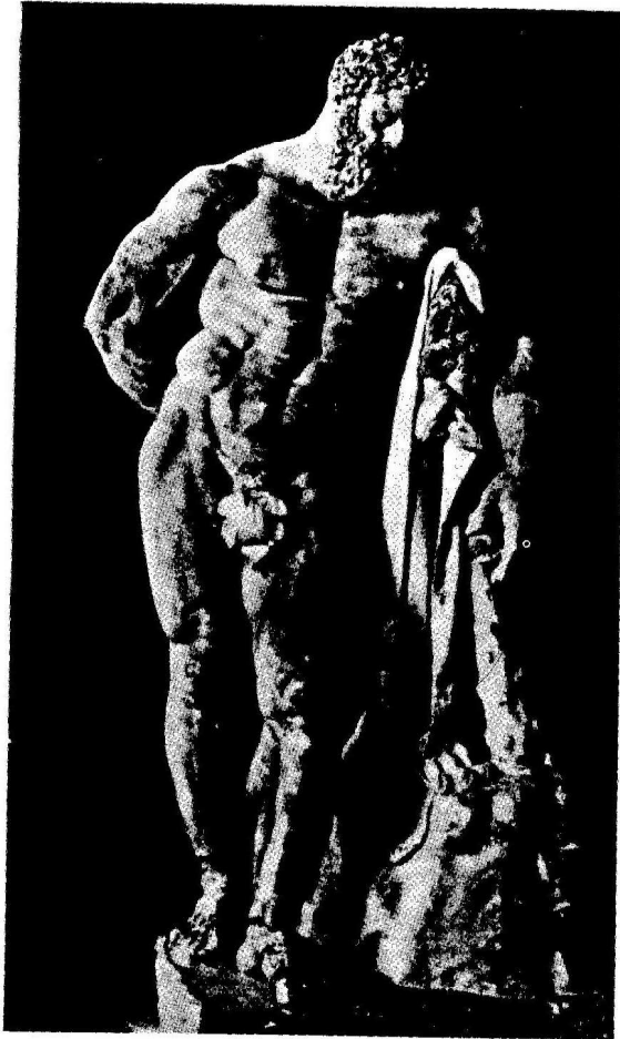
Heracles de Glicón de Atenas, conocido con el nombre de "Hércules Farnesio"