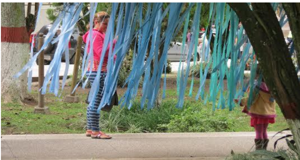
La Caricia del Viento. Instalación. Mayerlin Aray 2013.