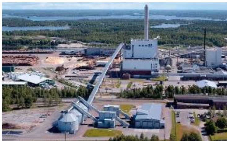
Figura 4: Planta de energía de biomasa Alholmens Kraft de 265 MW. Rodríguez, 2014.

Es por ello que Finlandia cubre con solo biomasa residual el 50 % de sus necesidades de calor y el 20 % del consumo de energía primaria, encontrando que el 65 % de las plantas industriales generadoras de energía a partir de la biomasa más grandes del mundo están en Finlandia (Rodríguez, 2014) para la cogeneración de energía a partir de biomasa residual (Figura 4). En este sentido, en concreto sumando 6 plantas finlandesas generan más de 950 MW de capacidad instalada.