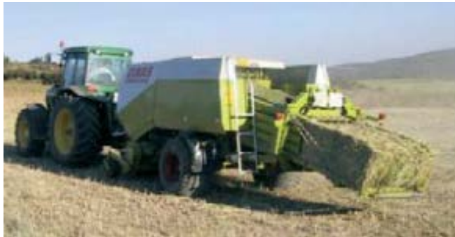
Figura 2: Empacado de la biomasa (paja) en el campo. Acciona Energy, 2015 (b).

Una referencia del aprovechamiento de la biomasa agroforestal con fines energéticos renovables, expone Acciona Energy con su Planta Industrial ubicada en Sangüesa, Navarra, España, la cual tiene una capacidad instalada de generación de 30,2 MW de potencia, a través de la combustión de la paja residual del aprovechamiento del cereal cultivado en la región (Sangüesa) como mejor se puede apreciar en las Figuras 2 y 3 (Acciona Energy, 2.015 (b)).