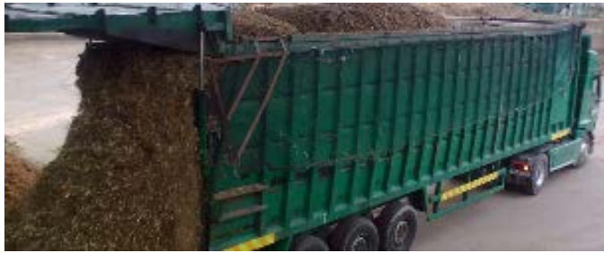
Figura 5: Transporte y descarga de biomasa en Irlanda. Sosa, 2010.

Otra referencia importante al respecto, son los esfuerzos que actualmente se está realizando en Irlanda en relación a la biomasa como fuente de energía y es precisamente no sobre la posibilidad de usar o no la biomasa como fuente energética, sino en concreto estudian las formas de optimizar la cadena de suministro con la finalidad de reducir los costos de transporte de la biomasa al mínimo (Sosa, 2.010), así como desarrollar metodologías para controlar y optimizar la carga útil de los camiones con biomasa y los factores de conversión del volumen sólidos a granel (Sosa, 2.015), Figura 5.