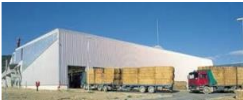
Figura 3: Transporte de la biomasa en camiones. Acciona Energy, 2015 (b).

Esta planta aprovecha alrededor de 160.000 toneladas de paja al año como combustible, logrando producir 200 GWh (giga vatios por hora) al año, equivalente a 60.000 hogares de la región, es decir, casi el 5 % del consumo eléctrico de Navarra en el 2005 solo de la paja del cereal, sin embargo, se prevé la incorporación de residuos madereros como ampliación de su capacidad de generación (Acciona Energy, 2.015 (a)).