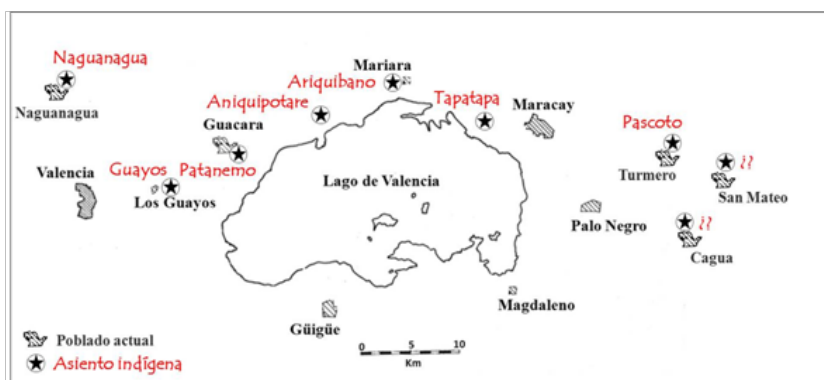
Mapa 2. Posible ubicación de los asentamientos indígenas de la cuenca valenciana del dieciséiseno. Elaboración propia.

actual pueblo de Turmero) y otro de nombre no mencionado en las fuentes, quizá localizado en las tierras del actual poblado de San Mateo. Es posible también -no obstante haber quedado en el anonimato documental del dieciséis-, la existencia de otro asentamiento dominando la ruta Sur-Este hacia los llanos guariqueños, acaso relacionado con el actual pueblo de Cagua (mapa 2).