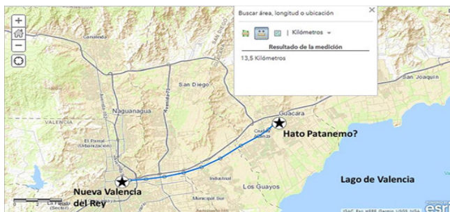
Mapa 4. Determinación espacial del hato Patanemo utilizando la aplicación arcgis. Nótese que la distancia de 2, 5 leguas (13,75 km) de separación entre esta unidad de producción y la Nueva Valencia del Rey es concordante con la distancia que separa el actual casco central de Valencia de la entrada Oeste del poblado de Guacara. Elaboración propia sobre mapa de arcgis.com

que pudiera aportar la disciplina arqueológica. Queda también la interrogante sobre las causas que truncaron la transformación a topónimo de la voz Patanemo en el área lacustre, aunado a la preferencia de Guacara como designación del pueblo de doctrina en el territorio presumiblemente ocupado por este indígena principal. En este sentido, es importante destacar el señalamiento de Nectario María (1970) sobre la ubicación del antiguo hato Patanemo, a dos leguas y media (13,75 km si se asume la legua castellana equivalente a 5,5 km) de la Nueva Valencia del Rey por el camino a Borburata, distancia que actualmente separa la plaza Bolívar de Valencia con la entrada Oeste de Guacara (mapa 4).