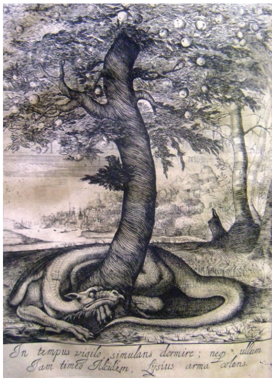
Imagen N° 2:

bilidad de palpar los avances del arte de imprimir en Europa para la época. Asimismo, puede apreciar los alcances de la circulación de volúmenes impresos en tiempos coloniales en esta parte del continente. 38 El análisis sobre el tráfico trasatlántico de libros, se muestra así como un elemento que permite comprender la conformación de bibliotecas en los lugares más apartados de las provincias hispanas de ultramar (V. Mapa N° 3). Es decir, acerca de los millones de libros que arribaron a Las Indias , tal y como lo determinó Irving Albert Leonard en The books of the brave (Los libros del conquistador) , un hecho que sólo fue posible gracias a los circuitos que interconectaban a las zonas pobladas entre sí, los cuales, aunado a otro importante mecanismo para la circulación de libros, el contrabando, hizo de cada volumen una mercancía que circuló con preeminencia por toda la América castellanizada.