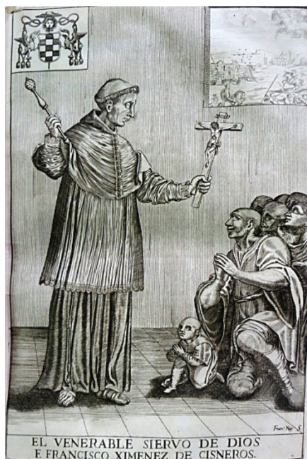
Imagen N° 1.

Grabado: El venerable siervo de Dios. F. Francisco Ximenez de Cisneros Ejemplar LA-447 del año 1653. Fondo Antiguo de la Biblioteca Central ULA