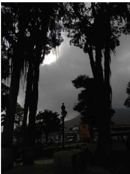
Figura 7.- Milla en el atardecer.

Siendo turistas de la ciudad es difícil sentir el espíritu de los lugares menos aún sentirnos merideños en términos de arraigo del lugar; no de “apego a” sino ese sentimiento amoroso que hace sonreír ante el frescor que regala un árbol en la Plaza de Milla, o el aroma de una casa que recuerda nuestra infancia (Figuras 7 y 8).