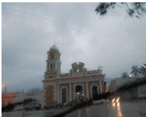
Figura 8.- Iglesia de Milla, el cristal y la lluvia.

El sentido de ser de un lugar solo se entiende al sentirse unido a un espacio geográfico como un todo; no por pertenecer a un territorio como espacio geográfico apropiado con unos límites geográficos imaginarios legales o político administrativos. No, es el sentimiento casi “inexplicable” de un amor filial por la ciudad. Solo de esa manera se puede comprender el sentido poético en que