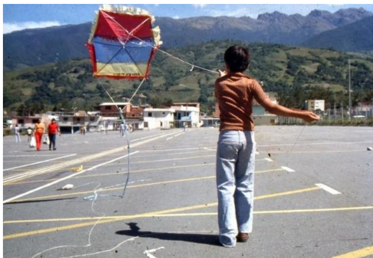
Figura 15.-Estacionamiento Soto Rosa vía mercado.

más nueva y al descubierto donde llegan la mayor parte de los productores (Figura 15 y 16).