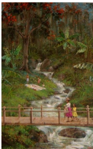
Figura 10- Bañistas en río Albarregas. Oleo s/mdf.

El rumor del río acompañado de su olor natural tornó a su fin. Hoy en día es un atentado al olfato transitar hacia el ocaso por el sendero de Cruz Verde y que penetren los aromas putrefactos del mal herido Albarregas. Sin embargo, el encanto al pasar por allí, como si me adentrara en una pagoda, permanece intacto en mí porque ese entramado verde y el jugar de la luz con las hojas de los árboles me conmueven cada vez que tránsito su sendero.