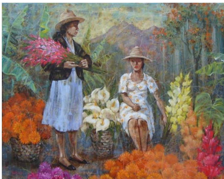
Figura 14.- Serie Mercados. Oleo s/tela. Fuente: Omar Cerrada (2008).

La ciudad se transformó en pocos años y de manera abrupta en un espacio poco amigable, sobre todo el casco central de Mérida, otrora lugar de reunión; antes nos planteábamos el problema de los buhoneros y la desorganización funcional de la ciudad, ahora nos encontramos con calles desoladas e inseguras en el día por la ausencia desde hace años de los policías ; los señores indigentes que abundan escudriñando junto a los perros en la basura para comer, los niños solos deambulando sin padres por las calles pidiendo limosna, buscando comida en las panaderías para desayunar o almorzar, o siendo explotados por sus propios progenitores. La basura, la delincuencia, cierta generación de jóvenes que en 20 años se acostumbraron al hábito de no trabajar sino a la cultura de la mendicidad, del robo y del esperar la limosna estatal bajo la premisa del gobernante "debe dárseles sin trabajar porque es su derecho luego de tanto años de exclusión social" ..; hasta a robar tienen derecho.."