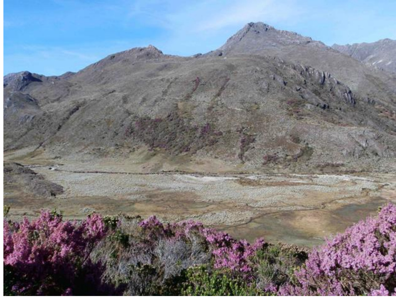
Figura 18.- Pantano Grande en Páramo de Gavidia. Andes Merideños Venezolanos.