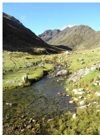
Figura 3.- Páramo de Gavidia, hacia Morro Alto.

Las nacientes y la presencia del malangá que anuncia a las minas de agua en los ecosistemas del bosque estacional de las laderas de la Otra Banda hacia Liria, Mocotíes Alto, San Rafael, la Pedregosa, Loma La Morita (Figura 4)