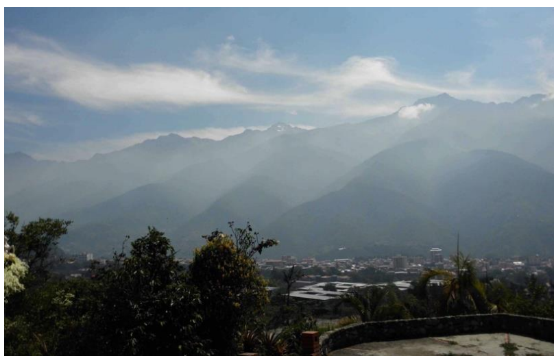
Figura1.-Mérida. La Liria en la Sierra Norte.

Ese estar “abrigada” la ciudad por sus Sierras del Norte (Figura 1) y Sur revelan su identidad como impresión estética pero igualmente geográfica del paisaje. Y es precisamente internándose en él que comenzamos a develar los lugares, esas estancias donde se respira y percibe de manera inmanente el espíritu de los lugares que dan identidad al espacio geográfico: el espíritu de la montaña.