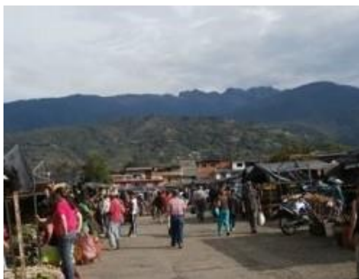
Figura 16.- Mercado Soto Rosa y la Sierra del Norte, Cara del Indio.

Hay un mini-mundo donde mirar y deleitarse en la frescura de las verduras, la textura de los granos, la tradicional venta de pollos vivos, la carne y quesos, las cachapas y tungas no pueden faltar ni la venta de maíz pilado para la elaboración