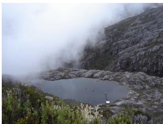
Figura 2.- Vía Alto de la Cruz hacia Los Nevados.

En Mérida está presente su cosmogonía y cosmovisión andina: las piedras sagradas, las lagunas, los picos, la montaña; ello expresa su sentido de ser, su esencia, estén o no habitadas (Figuras 2 y 3). El silencio del páramo, el lenguaje de las aguas al correr entre las rocas y estrechos senderos andinos, la quietud de las lagunas y su bramido cuando “extrañan” a alguien que se acerca por vez primera; la lluvia de arco.