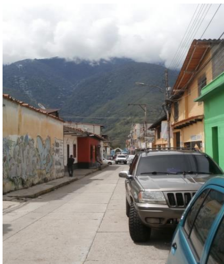
Figura 9.- Desde la calle 24 hacia El Espejo, camino silente y siento que mis pasos me llevarán sin pausa hacia la Sierra Nevada.