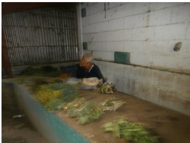
Figura 12.-Ventas de plantas medicinales en Jacinto Plaza.