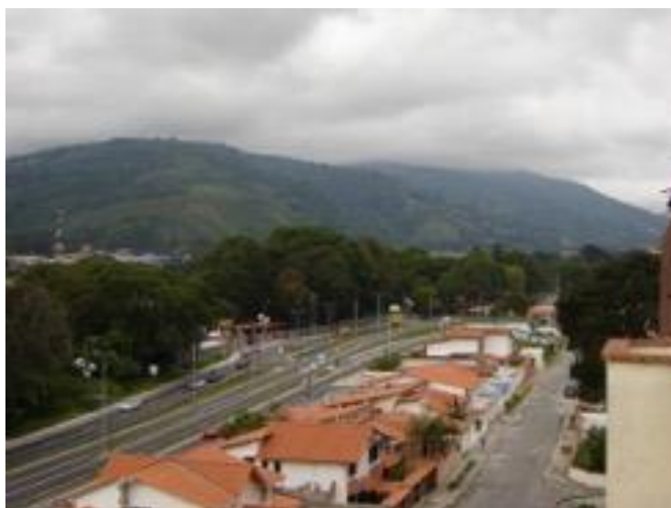
Figura 17.-Avda. Andrés Bellos, Las Tapias.

asidua, amigos de tertulia -tan necesaria en estos tiempos-, vecinos que hacen de ese espacio su lugar.