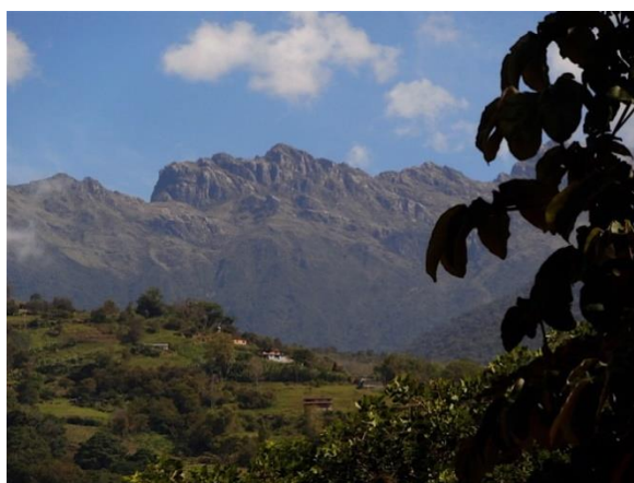
Figura 6.- Cara del Indio desde la ciudad de Mérida.

Y ese espíritu se experimenta en las sierras desde las nacientes del río Chama hasta su cuenca media hacia la zona seca, con las particularidades que puedan nacer de la altitud y la presencia de la zona semiárida en plena Cordillera Andina (Figura 6). Pero estos rasgos están allí y hechizan el corazón amante del paseante y, también, en forma menos evidente pero no menos intensa del habitante.