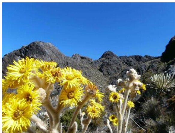
Figura 5.- Lagunas Bravas. Páramo de Gavidia

Los derrubios desparramados en la sequedad del desierto periglacial, las espeletias en flor tapizando junto a la vegetación en cojín las laderas y planicies de los páramos altos; la humedad, las lagunas (Figura 5 y 6), los “encantos” que identifican el paisaje de Cumbres .