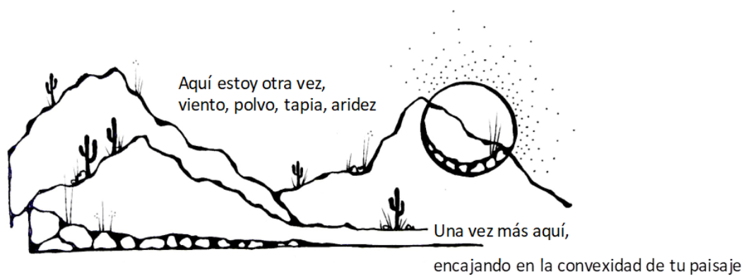
Figura 19.- Jamuen Tinta s/cartulina. Fuente: Johana Lovera (2000).