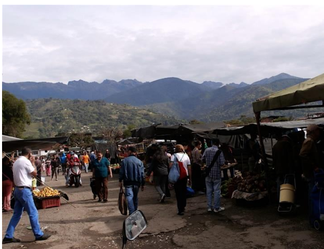
Figura 13.- El espíritu del mercado Soto Rosa.

Llegan ahora a mi mente las líneas escritas en “Viaje al Amanecer” y logro entender el apasionamiento de Picón Salas con su ciudad, nuestra ciudad, y enamorarme una y muchas veces más de este habitante de Cumbres, escritor y paisano a través de sus palabras tan evocadores que emanan de su corazón: