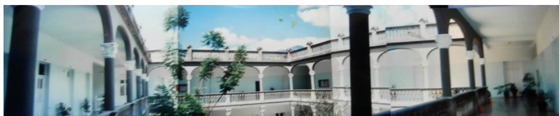
Figura 11.- Antigua Colegio San José. Mérida.

Ya saliendo hacia Liria en el Núcleo Universitario de Derecho, Humanidades y Faces me topo con otro rostro distinto. Liria dejó de ser el campo de potreros y en él se sembraron las infraestructuras de concreto que acogerían al mundo del conocimiento, como una vez lo hizo el Seminario San Buenaventura y el antiguo Colegio San José en la ciudad (Figura 11), lugares que aún existen. El Seminario se mudó a Las Heroínas para albergar el mundo teológico. Y el Colegio San José para dar amorosa cabida a las Artes: la Danza, la Música, la Galería La Otra Banda...unos saberes y artes que se supieron enraizar en este espacio como sus espléndidos árboles en tan noble arquitectura.