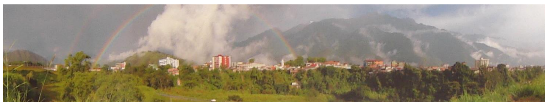
Figura 21.- Mérida

Sigue existiendo Cumbres con los cambios de un urbanismo que quisiera devorar con su presencia las montañas, siguen estando los mercados con ese "no sé qué" de la ciudad, y que aún en el mismo lugar no son los mismos porque su mezcla con lo nuevo de Mérida les otorga otro sentido (Figura 21). Sin embargo y aunque parece contradictorio para mí misma, también hay mercados y mercaditos de la ciudad que aun estando rodeados del cambio urbano, cuando se penetra en ellos se siente el mismo espíritu de siempre, ¿está eso en la gente que lo habita, con más años pero que sigue estando allí? como en el Mercadito de la calle 21 o los puestos de los sábados entre las calles 20 y 21 con avenida 2 Lora; o ese aire del Mercado Periférico o del Jacinto Plaza.