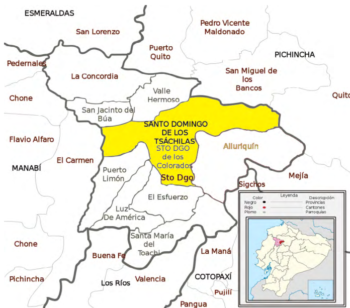
FIGURA 1. Ubicación relativa de la ciudad de Santo Domingo, cantón Santo Domingo, Ecuador.

hematológico Marca Rayto (RT-7600, Vet Auto Hematology Analyzer, Rayto Life and Analytical Sciences Co., China 03-2017).