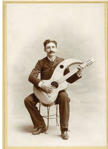
A la izquierda, una “Guitarra arpa de brazo hueco” construida por Otto Anderson, mientras trabajaba para Chris Knutsen, a fines del siglo XIX. A la derecha, Guitarra Anderson/Knutsen.