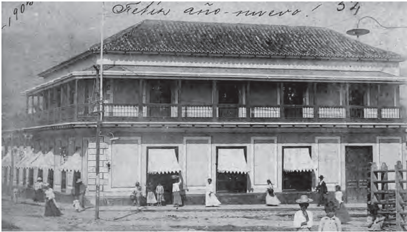
Vista del edificio de la Casa Steinvorth. San Cristóbal, [c. 1905].