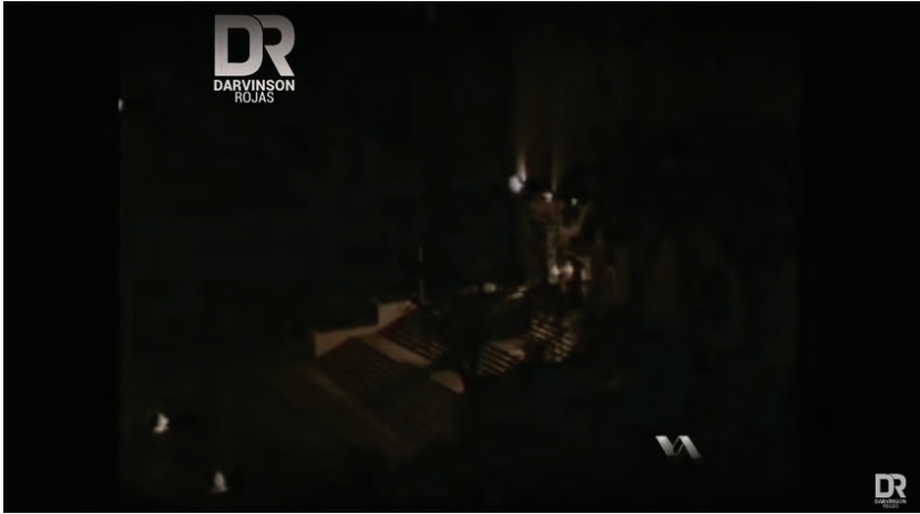
IMAGEN 6. Vehículo blindado embistiendo las puertas del Palacio de Miraflores, 4 de febrero de 1992.