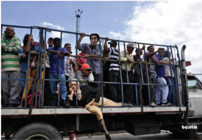
IMAGEN 5. Francisco Bassim. “Perrera”, 2018.

Francisco Bassim (ver imagen 5), propone una extracción de la figura de Francisco de Miranda de acuerdo al cuadro de Arturo Michelena de 1896, recostado, incorporándolo a un escenario itinerante, distinto, representado en una de las “perreras” que atravesaron y aún cruzan las ciudades venezolanas. A partir de la democratización del uso de las imágenes, y del poder que le significan, el artista adiciona la figura de Miranda a la tolva de un camión saturado de personas que lo emplean como medio de transporte, en el extremo superior se aprecia una intervención en el rostro de uno de los usuarios de la “perrera”, quien presenta la efigie de Bolívar extraída del billete de cien bolívares (100bs), erario de más alta nominación en ese momento, muchas veces reconvertido y vuelto a devaluar, conocido como el “bolívar fuerte”; hoy por hoy prácticamente sin ningún valor monetario.