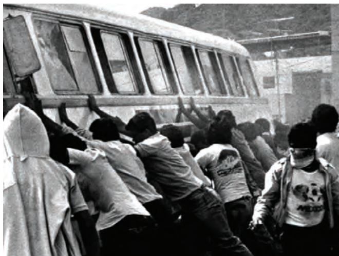
IMAGEN 2. "Quema de autobuses", 1989.

Como texto introductorio a la exposición de 1971, iniciaba también una forma de hacer arte en función de las prácticas urbanas, pero al mismo tiempo, era el resultado de una serie de observaciones que van más allá del orden estético, pues se planteaba interrogantes que abordaban de plano problemáticas, temores, angustias e incluso la muerte como tópicos estructurales de una población anónima, signada por el abandono de sus verdaderas necesidades. Se trata de la precisión de una especie de fractura irreversible, de algo que ya se podía corroborar con datos altamente sustentables, demostrando claramente su agotamiento en marras. 21 Tan importante panorama de desajustes sociales en medio de una boyante economía que se traducía en epítetos como la Gran Venezuela, o la Venezuela Saudí, exponía una imagen que no podía escapar de los radares del arte, mismo que establecía conexiones de orden plástico con la intención de ilustrar de la manera más descarnada posible tan inocultable panorama, usando una metáfora de la otredad, el inmenso colectivo anónimo que se reflejaba en esta práctica