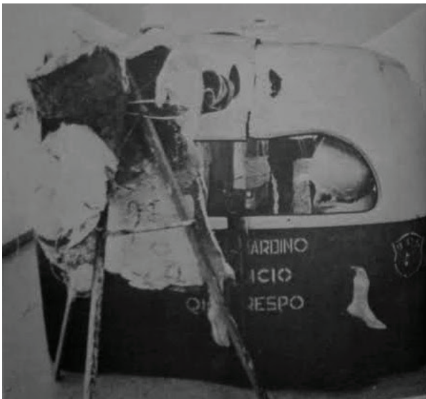
IMAGEN 1. Vista de "El Autobús", Obra de Stone, Nebreda y Chacón. El Nacional , 28 de marzo de 1971. p. C-9. ARTE.

o relacionamiento, mismas que incentivan el proceso de interpretación hasta encontrar una verdadera ruta de sentido, un mínimo común entre las imágenes que puedan usarse para explicar procesos históricos sostenidos en el tiempo. Esta premisa concentra su origen en la obra de los tres artistas venezolanos en 1971, misma que reflejó un cambio sustancial en el orden estético del arte venezolano, incluso se planteó de forma tangencial dentro de las perspectivas del estudio de las prácticas urbanas, aún sin estar totalmente teorizadas. Ahora bien, allende las bases estéticas que se subvirtieron, existen algunos aspectos que son determinantes para entender este momento y que representaron de forma conceptual un “quiebre” avizorando tiempos complejos por venir en el país. Para el ya mencionado crítico de arte Roberto Guevara, presentador de la exposición, esta instalación (ver imagen 1) reflejaba las inquietudes de una población que, a pesar de los ingentes recursos devenidos de la industria del petróleo durante la década del setenta, ya mostraba indicios del agotamiento y del hastío de la población ante una gran asimetría social que crecía exponencialmente, cuya urgencia era capitalizada en la imagen de los momentos de trashumancia en un autobús destartalado, sin mayores esperanzas y con el estigma de ser uno más en una ciudad que se les hacía extraña, difusa, injusta y compleja; así los artistas,