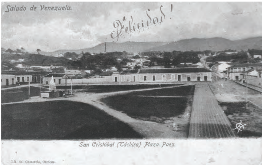
Tarjeta postal con una vista de la antigua plaza Páez.

El costado este es el que se observa al fondo. San Cristóbal, [s.f.].