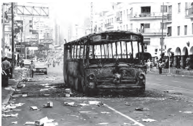
IMAGEN 3. “Quema de autobuses”, 1989.