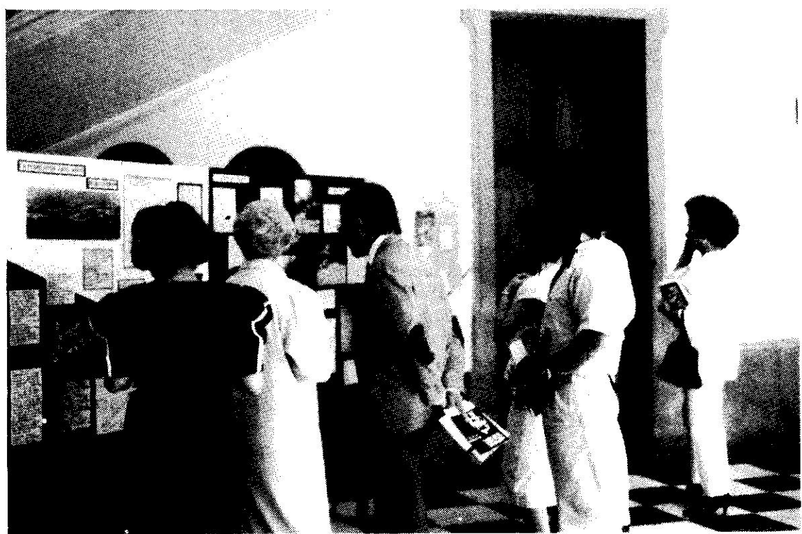
El Vice-Rector y otros miembros del público observando el tríptico "LA PEDREGOSA : 1400 AÑOS DE HISTORIA"

. 5 al 9 de septiembre de 1990: II Congreso Mundial de Arqueología, Cartagena, Colombia. Dicho evento, que había de realizarse en nuestra ciudad de Mérida, tuvo que ser trasladado a Colombia a causa de la inesperada y nueva situación económica de Venezuela, la cual no permitía seguir haciendo este gasto. Hacemos votos para que el mismo sea todo un éxito para Cartagena y para el Museo del Oro, que lo organiza con la ayuda del Banco de la República.