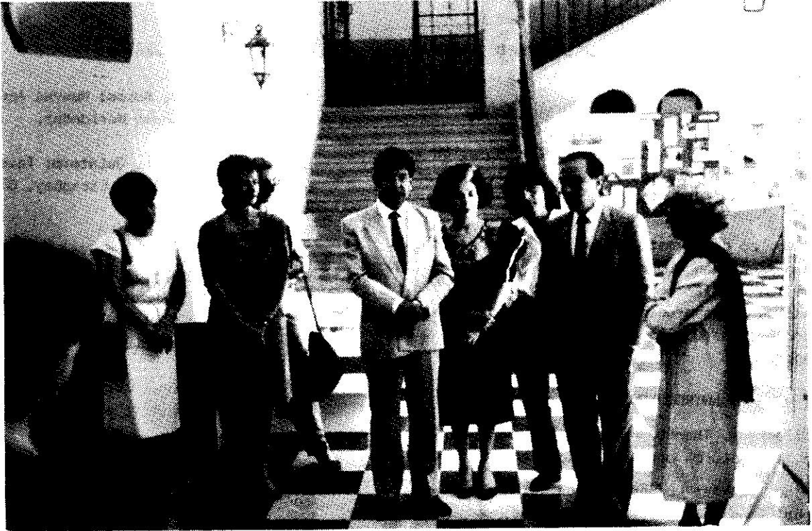
El Vice-Rector Académico de la Universidad de los Andes y el Decano de Humanidades inaugurando la exposición " Artesanía Indígena del Amazonas "