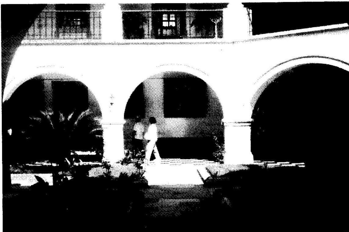
Aspectos de la exposición "DE LA PIEDRA AL SIMBOLO"