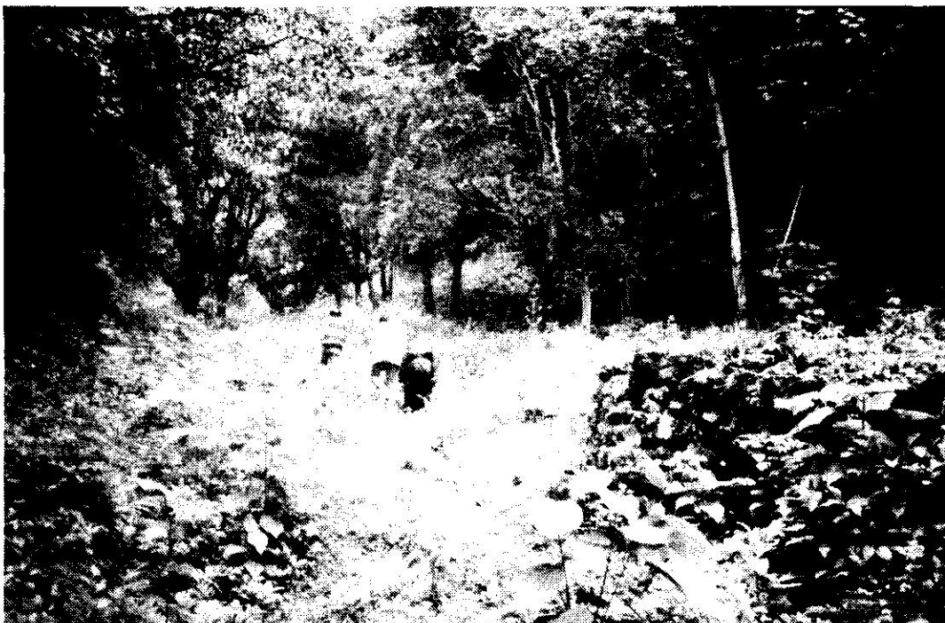
Sitio de La Pedregosa Alta, agosto 1987.