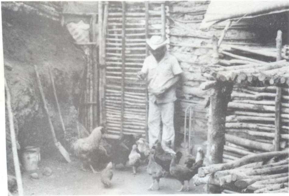
Habitantes de La Trampa.