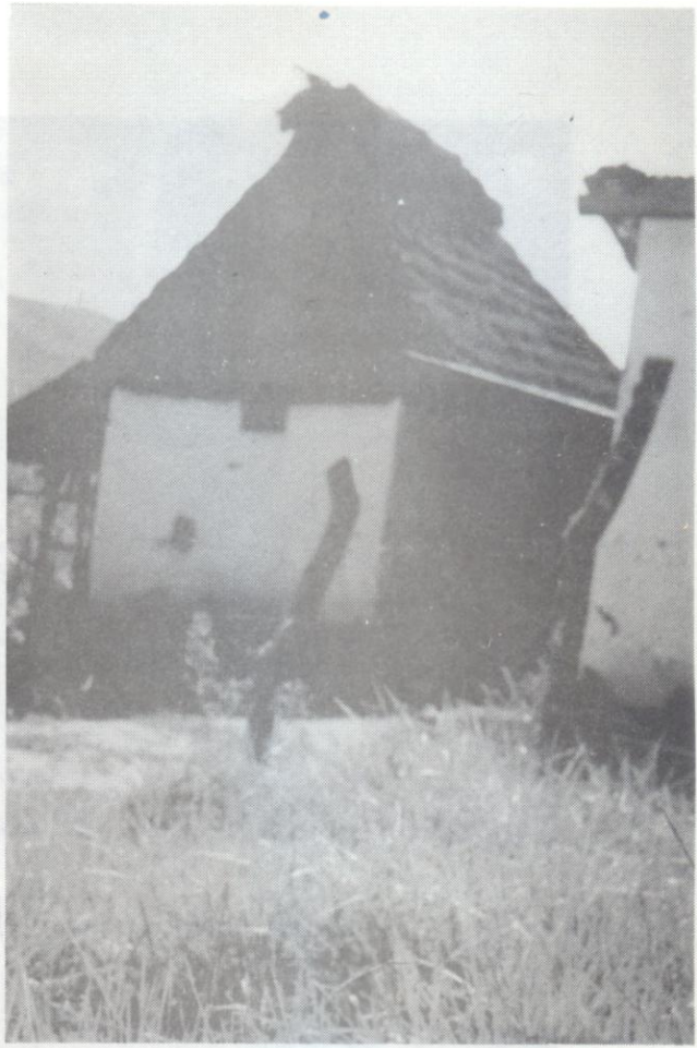
Casas de La Trampa.