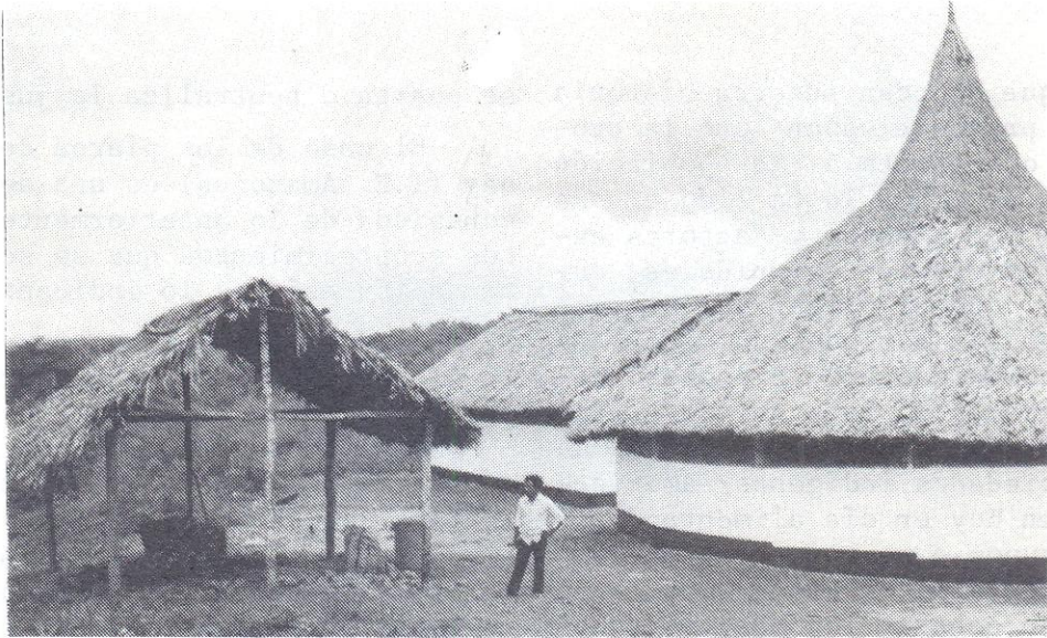
Taller Artesanal Comunitario Piaroa de "Babilla de Pintao" (Dpto. Atures, T. F. Amazonas). Promovido por el IAN y sujeto a beneficiarse del Convenio EVENAR C.A. — IAN.