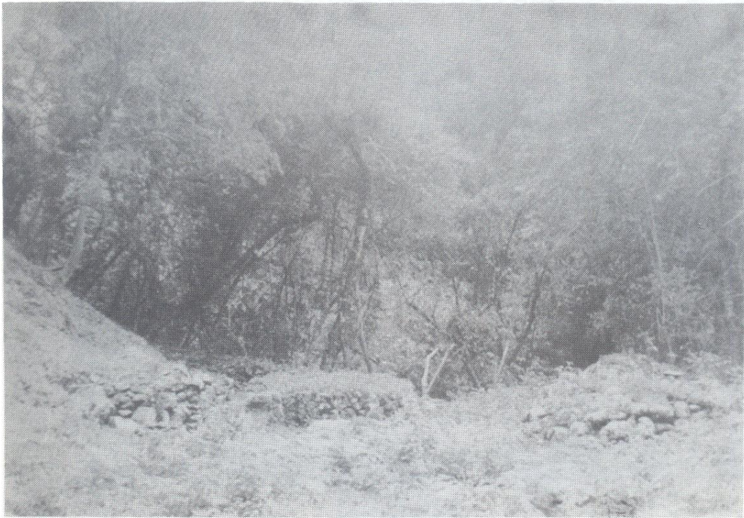
Sitio La Pedregosa Alta, junio 1987.