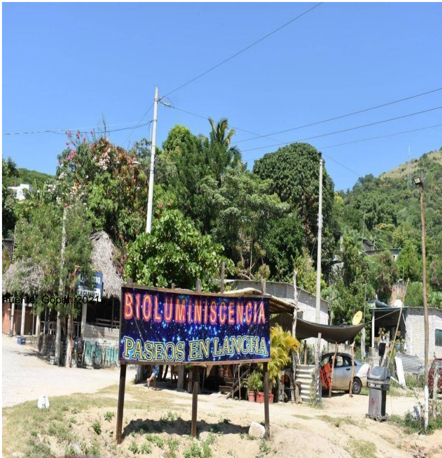
Figura 2 La bioluminiscencia como negocio

Por otro lado, tenemos un acaparamiento de tierras de propiedad social para desarrollos inmobiliarios dónde se ofrece exclusividad y discreción, propiedades tipo resort y segundas residencias con precios exorbitantes, propiedad de empresarios, políticos y familias con nexos en el narcotráfico. Un hecho interesante de cómo la figura del narcotraficante ha migrado a una figura de empresario que diversifica sus ingresos; para el caso de la costa oaxaqueña esa diversificación se materializa en la adquisición de propiedades y la construcción de hoteles y restaurantes en todo lo largo y ancho de la costa oaxaqueña, en donde las relaciones con políticos de diversos partidos, son claras y evidentes.