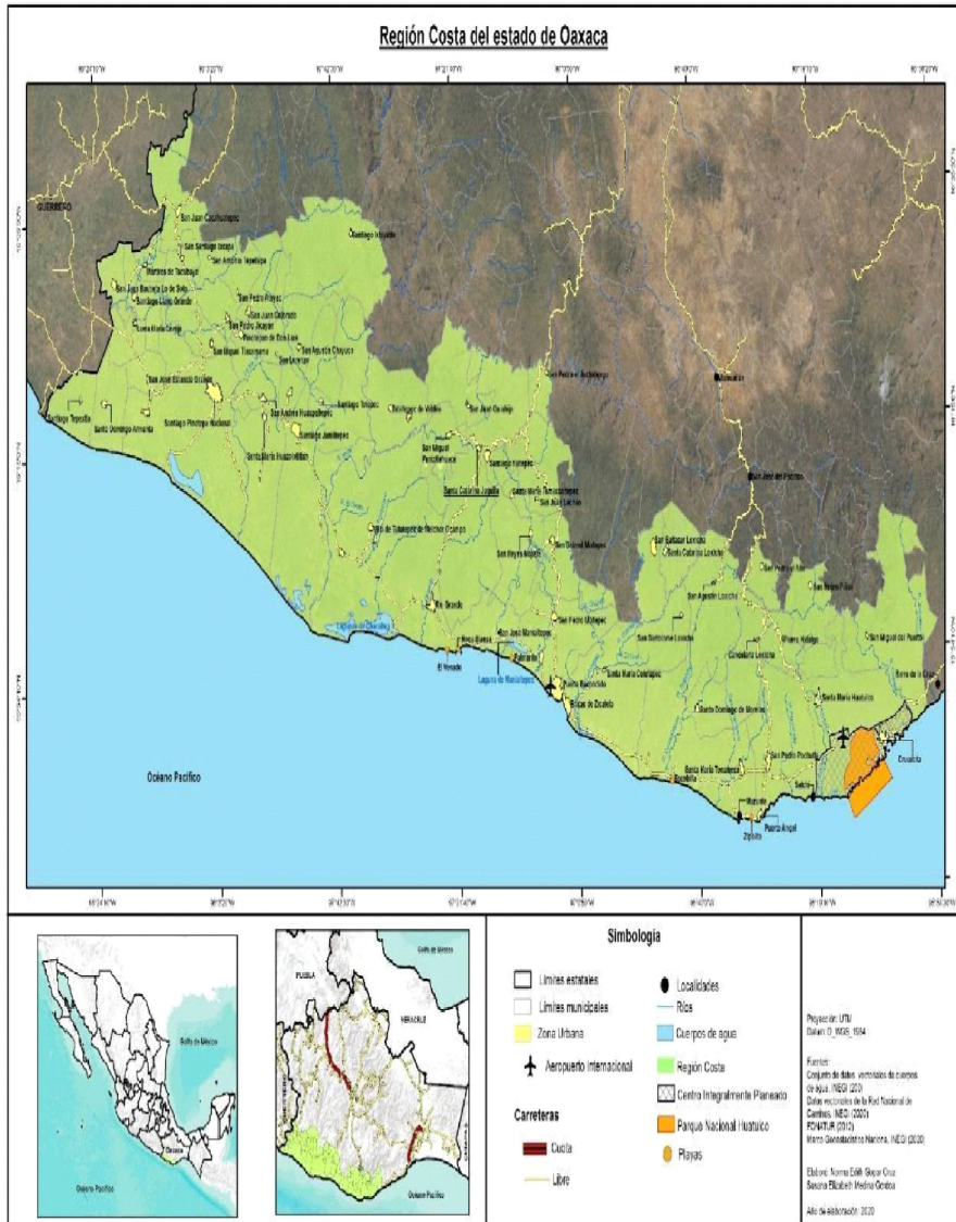
Figura 6 La región Costa y las ciudades turísticas

Fuente: Elaboración propia con base en trabajo de campo, 2020.