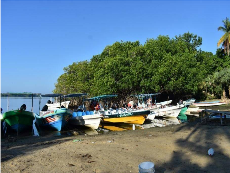
Figura 5 Las palapas de los cooperativistas