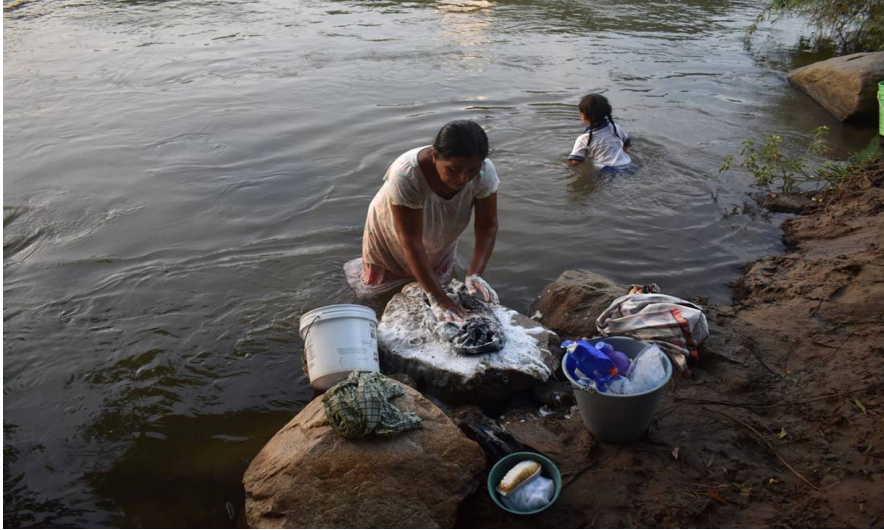
Figura 3 El lavado de ropa en el río