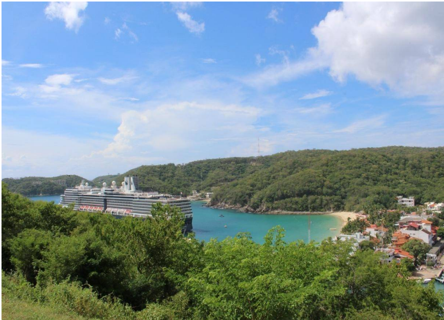
Figura 4 El crucero de la élite