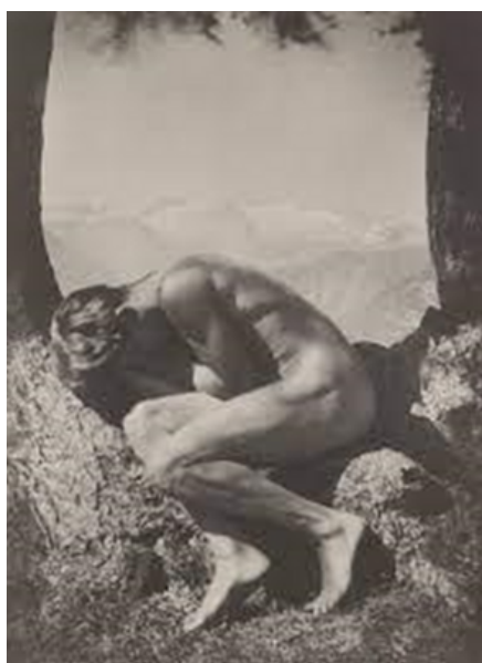
Rudolf Koppitz, In the Boson of Nature (1923)