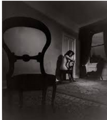
Bill Brandt, desnudos (1929).

Entre los años sesenta y setenta la liberación sexual aporta nuevas nociones del cuerpo desnudo. La concepción objetiva de los primeros ejemplos fotográficos es sustituida por una más subjetiva, que incorpora el rostro a la composición, enfatizando sus expresiones. Esto aporta a las imágenes un componente psicológico de mayor profundidad, un agregado que está más a tono con el objeto y finalidad del lenguaje fotográfico contemporáneo del desnudo: fotografiar una persona desnuda en un sentido holístico, incluyendo no solo la apariencia física del modelo sino su carácter, su personalidad.