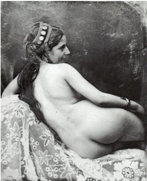
Anónimo. Academie, ca. 1845. Daguerrotipo, George Eastman House, Rochester (Nueva York).

En los albores de la fotografía del siglo XIX, las imágenes de desnudos con daguerrotipo de Thomas Eakins (1833) presentan un realismo y naturalismo semejante al de la pintura de Gustave Courbet y Manet. Luego encontramos otros desnudos como los de Julien Vallou de Villeneuve (1853), Felix Jacques Moulin (1800-1868) y Auguste Belloc (1850-1868), en los que la figura femenina asume poses venusinas, escultóricas, muy a tono con la helenofilia de la época. A pesar del cliché teatral de estos desnudos, en las vistas estereoscópicas de Belloc (1850-1868) comenzamos a ver un tipo de fotografía distinta, más transgresora, que refuerza el valor exhibitivo del cuerpo femenino y reaviva la brecha entre lo erótico y obsceno, anticipada ya por la pintura.