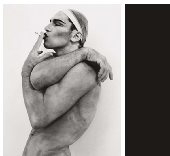
Vladimir I, Hollywood, 1990.