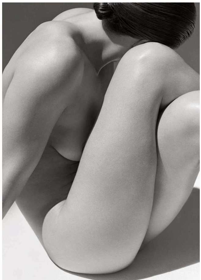
Desnudo sin título I , Miami, 1997.