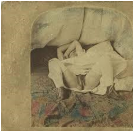
Auguste Belloc. Fotografía obscena.