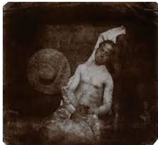
Bayard, Autorretrato de un ahogado (1840) Desnudo de carácter político.

El desnudo fotográfico tiene en su origen una función utilitaria doble: en primer lugar, está ligado a la pintura como una alternativa que permitía al artista sustituir al modelo real en el taller, durante el proceso de creación de la obra. En segundo lugar, este tipo de fotografía servía de herramienta para registrar visualmente cuerpos de sujetos que eran de interés político, científico o etnológico. En la actualidad, el tema del desnudo en la fotografía constituye un género discursivo especializado, de carácter estético. La transición en los valores apreciativos (de lo utilitario a lo estético) de esta expresión visual no ha sido inmediata. Para ello fue necesario un cambio profundo en los modos de percibir, sentir y pensar el cuerpo femenino y masculino desnudo en relación con su entorno, al mundo que los rodea, y cómo estos eran captados por la cámara.