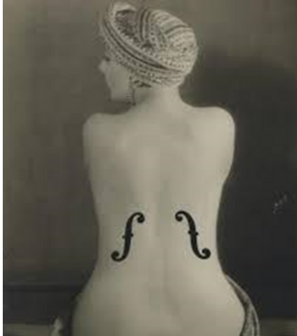
Man Ray, El violín de Ingres (1924).

VOZ Y ESCRITURA. REVISTA DE ESTUDIOS LITERARIOS N° 31, ENERO - DICIEMBRE, 2025 DEPÓSITO LEGAL 89-0023 / ISSN: 1315-8392. DEPÓSITO LEGAL ELECT.: PPI 2012ME404