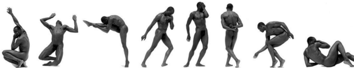
Bill T. Jones I-VIII, Los Ángeles, 1995.

Las composiciones de Ritts son impecables, sobrias, armoniosas y equilibradas. Además de ser un maestro en la luz y del blanco y negro, su trabajo nos lleva a comprender el carácter multidisciplinario actual de la fotografía. Nuestro cierre con Ritts busca, por una parte, hacer elástica la mirada del estudiante que desea introducirse en el campo de la fotografía a través del desnudo, y, por otro lado, romper con los prejuicios que puedan estar vigentes todavía en él, sugeridos por las viejas divisiones arbitrarias de "lo alto" y "lo bajo", "lo artístico" y "lo comercial". Por la cámara de Ritts pasaron desde el Dalai Lama hasta Britney Spears, incluyendo íconos del cine hollywoodense, tops models como Cindy Crawford y bailarines consagrados. Todas sus imágenes tienen algo de ambigüedad que impacta, son, en fin, una búsqueda hacia la interioridad de la condición humana y la belleza total, orgánica. Es por su capacidad para empatizar con el modelo y aflorar en cada toma su lado más espontáneo, sin olvidar la importancia de la configuración del encuadre, que sugiero su obra como muestra ideal de la relación: fotógrafo-modelo.