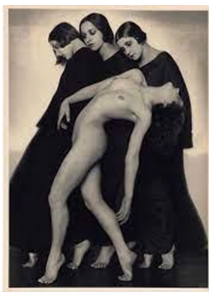
Rudolf Koppitz, Motion study (1925).