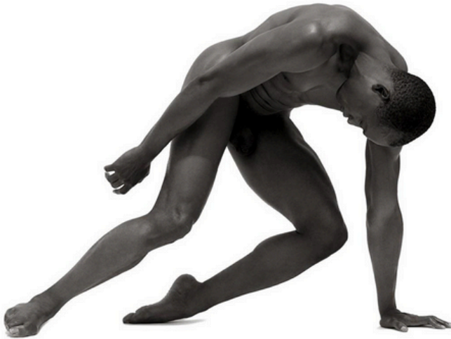
Bill T. Jones I-VIII, Los Ángeles, 1995.

VOZ Y ESCRITURA. REVISTA DE ESTUDIOS LITERARIOS N° 31, ENERO - DICIEMBRE, 2025 DEPÓSITO LEGAL 89-0023 / ISSN: 1315-8392. DEPÓSITO LEGAL ELECT.: PPI 2012ME404