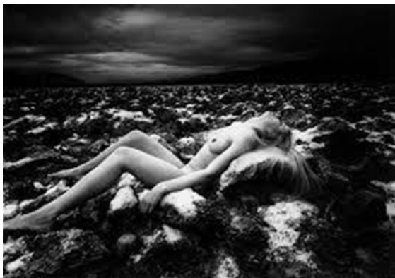
Kishin Shinoyama, Death Valley 2 (1969).

Hay en este arte algo misterioso, que supone un enigma: descifrar la mirada de quien fotografía. Para Walter Benjamin, en los rostros el valor cultural tiene su último refugio, esto quiere decir que hay algo del aura de la persona que se atrapa en la imagen: su especificidad en conexión con la historia y el mundo. Un cuerpo fragmentado, en cambio, tiene un valor más exhibitivo, objetual. El ser humano y la realidad del desnudo se plantean solo parcialmente y de forma despersonalizada. Es por ello que en el desnudo contemporáneo, de los setenta en adelante, el rejuvenecimiento de este género pone en jaque las distinciones de contenido, sedimentadas hasta el momento, que se debaten entre lo artístico, lo erótico y lo pornográfico. Las fronteras entre lo convencional y no convencional se transgreden e importa menos si el desnudo se justifica o no. Como bien señala Zeemeijer, hay una liberación del sentido, la interpretación erótica se vuelve irrelevante para su apreciación estética. Pero lejos de simplificar la cuestión de la división del género por su tema, el desnudo plantea nuevos desafíos. Un ejemplo de ello es cómo el trabajo de Kishin Shinoyama hace tambalear las nociones de tabú en la cultura occidental, o cómo el neorromanticismo del muy controvertido David Hamilton, con sus reminiscencias prerrafaelistas en el uso de la luz y del color, conjuga lo sublime y lo sensual en medio de un mundo realista y rutinario.