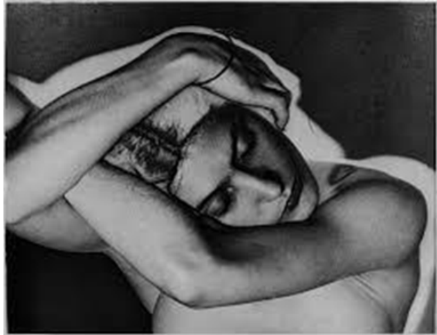
Man Ray, Mujer dormida .