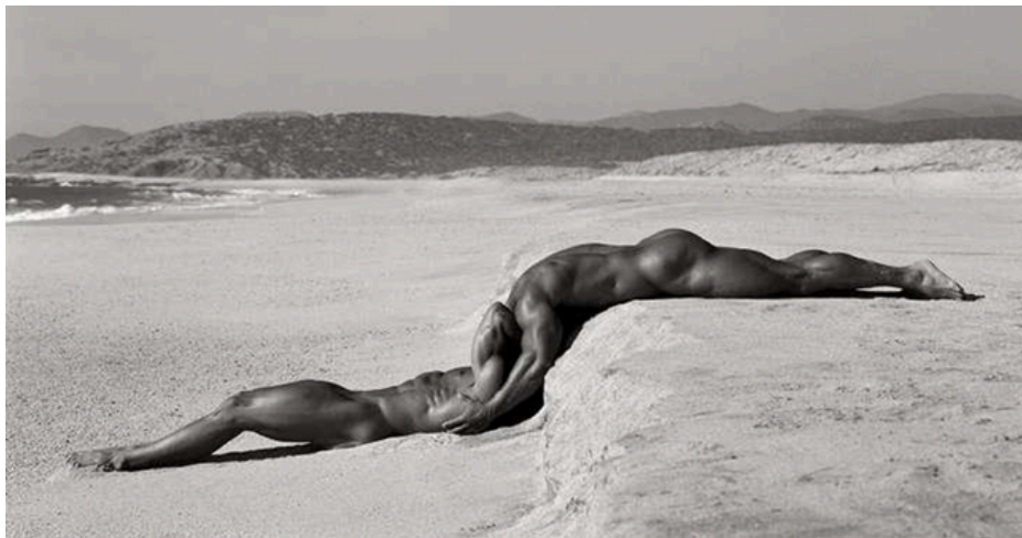
Dúo I, México, 1990.

Ritts entiende la fotografía a través de la metáfora de la danza, como una especie de conexión comunicante que se establece entre el modelo, la cámara y el fotógrafo, y que, por tanto, debe disfrutarse. Es importante que la imagen resultante dé cuenta de la naturaleza y grado de conexión entre los tres elementos de este diálogo corporal, que capte y aflore toda la carga sensible que se activa durante su proceso de las tomas y de cuenta de la naturaleza humana del sujeto fotografiado.