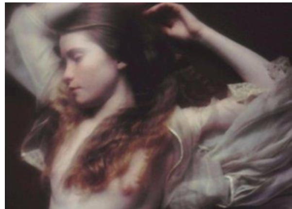
David Hamilton (1971).

Esta breve historia del género fotográfico del desnudo es también la historia de los valores representacionales y perceptivos del cuerpo en Occidente. A finales del siglo XX, otro concepto, el comercial-publicitario, se sumará a los ya descritos. La fotografía del desnudo, primero con fines utilitarios, científicos, documentales y eróticos; luego con fines estéticos, comienza a considerarse en tanto mercancía publicitaria. Los fotógrafos encuentran, así, un mercado alternativo para sus obras. Nos encontramos, entonces, con