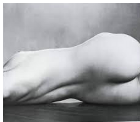
Edward Weston (1923), en exterior... en interior.