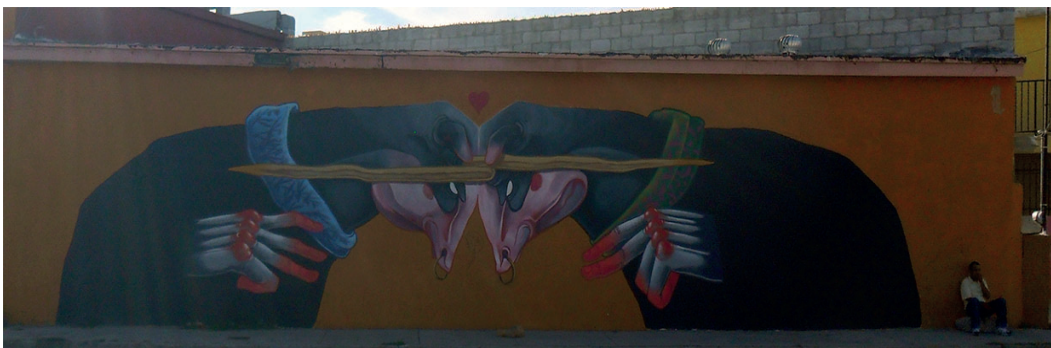
Fig. 12. Participación de Malakay en Color Walk. Calle Montemayor. 2014.