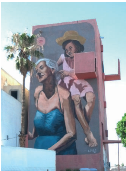
Fig. 3. Mural elaborado por Mariela Ajras para el proyecto Color Walk. Zona Pronaf. Año 2014.