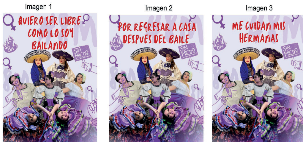
Figura 2 Post de Smacht Academy

Símbolos: La danza folclórica se resignifica como expresión de resistencia. El 8M enmarca el mensaje en la lucha por