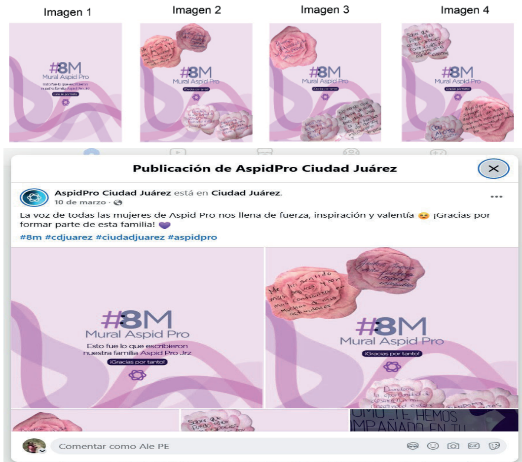
Figura 3 Post de AspidPro

Nota. Imagen recuperada de Facebook de AspidPro ( https://www.facebook.com/share/p/1CWQqtSa2C/ )