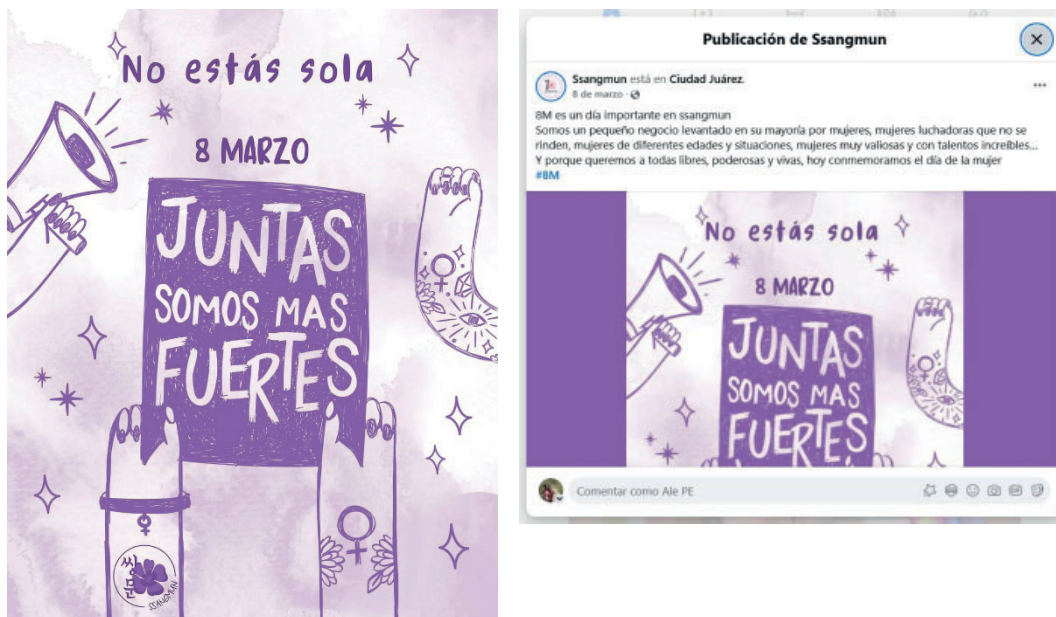
Figura 4 Post de Ssangmun

Nota. Imagen recuperada de Facebook de Ssangmun ( https://www.facebook.com/share/p/1BvcicUnn4/ )