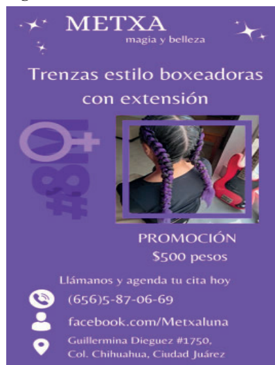
Figura 1 Post de Metxa