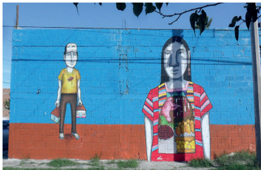
Fig. 10. Participación de Los Dos en el proyecto Color Walk. Calle Vicente Suarez. Año 2014.

Jellyfish . Además, fue un ejemplo de las obras internacionales que configuraron el museo urbano en Ciudad Juárez.