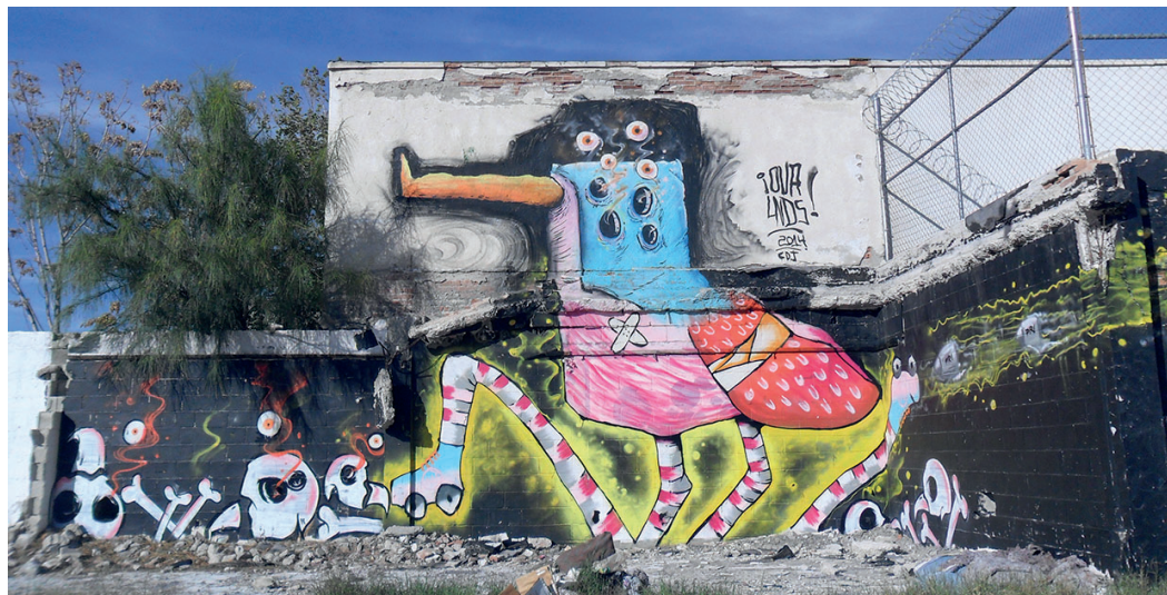
Fig. 11. Participación de Ovrlns dentro del proyecto Color Walk. Calle Montemayor. 2014.

El proyecto Color Walk fue un esfuerzo social del colectivo Jellyfish por producir en los habitantes de la colonia dinámicas afectivas hacia los murales y la infraestructura con símbolos, signos y composiciones lúdicas que produjeran experiencias estéticas entre los transeúntes. Por lo tanto, los integrantes plantearon que los murales se convirtieran en elementos discursivos destinados a cambiar la cotidianidad de los colonos a través de “una serie de atributos y valores que contribuyen a hacer más fácil y llevadera la existencia humana en las ciudades, a enriquecer su experiencia y a la respuesta que suscite en el observador haciéndola clara, explícita y sensorialmente agradable” (Buraglia, 1998, p.3). Por ejemplo, en la figura 12 el muralista Malakay representó unas figuras surrealistas que poseen forma de animales con manos, con lo que se produce una experiencia estética al descifrar el contenido de la obra.