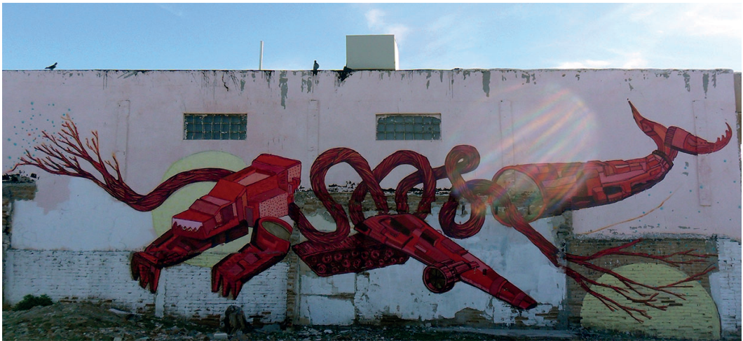
Fig. 9. Participación de Román dentro del proyecto Color Walk. Calle Vicente Suarez. 2014.

tres animales con patrones decorativos de las artesanías propias de las comunidades originarias del centro de México.