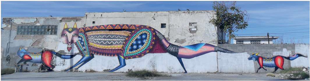
Fig. 8. Mural elaborado por Spaik Pike para el proyecto Color Walk. Calle Montemayor. 2014