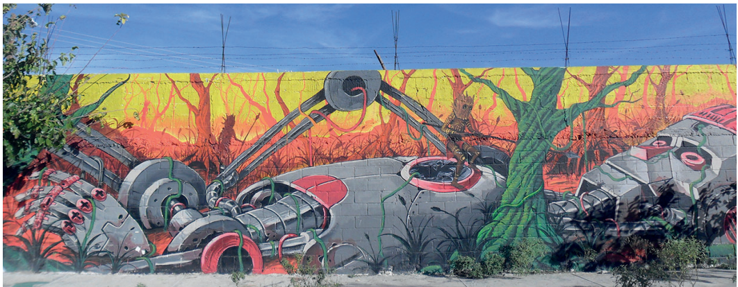
Fig.1. Mural elaborado por Calavera Crew para el evento Color Walk. Colonia Melchor Ocampo. 2015

El fomento del turismo se materializó en los murales que realizaron los artistas internacionales sobre la infraestructura del anillo envolvente del Pronaf, puesto que fue considerada una zona comercial y nocturna durante la década de 1990 y los primeros años del 2000. Específicamente, se intervino el Centro Artesanal, actualmente conocido