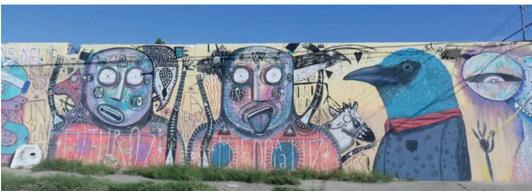
Fig. 13. Participación de Jellyfish en Color Walk. Calle Vicente Suarez. 2014.

El proyecto Color Walk también cumplió con una función social al buscar el desarrollo de diferentes procesos de apropiación de los murales mediante la fomentación de sentidos de pertenencia para su cuidado y mantenimiento. La pertenencia produjo que “las personas y los grupos se autoatribuyan las cualidades del entorno como definatorias de su identidad” (Vidal, et al, 2005, p. 238) individual y colectiva. El colectivo buscó que los colonos reconocieran la importancia de los murales en la creación de entornos estéticos y seguros en sus vidas cotidianas. Al respecto, Pilo señaló que: