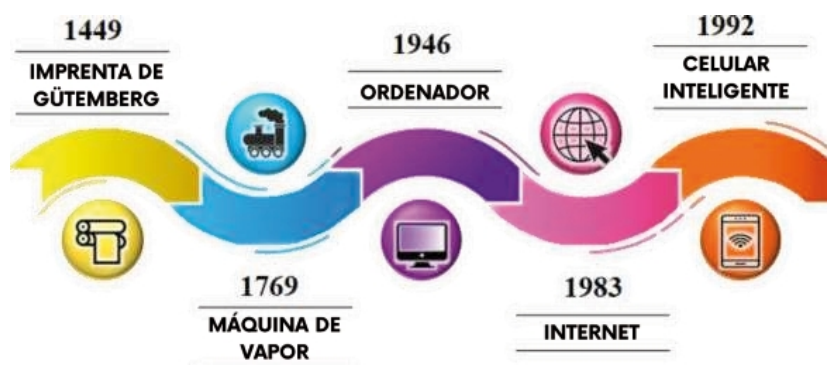
Figura 2. Hitos Inventivos

En la revolución tecnológica digital, la alfabetización se ha convertido en una habilidad esencial que incluye el uso de computadoras, internet y otras herramientas digitales en varios espacios del entorno cotidiano. Pero ésta, continúa una evolución acelerada gestada sobre esta base tecnológica que da pie a la economía digital donde convergen e interactúan varios enfoques de la operatividad laboral, educativa, financiera cotidiana que responde al protagonismo que hoy día impulsa el uso del Smartphone o celular inteligente, lo cual redimensiona el entorno social y abre nuevos espacios de interacción, donde la alfabetización trasciende de “Tecnológica” con el mero uso de dispositivos tecnológicos a “Informativa”, dado su enfoque comunicacional donde se alude a lo digital, mediático y crítico que surge de esta nueva dimensión.